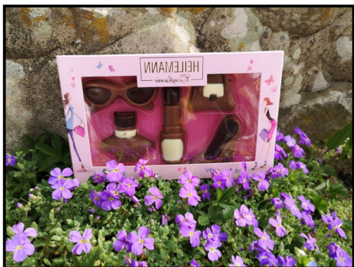
Pour les filles