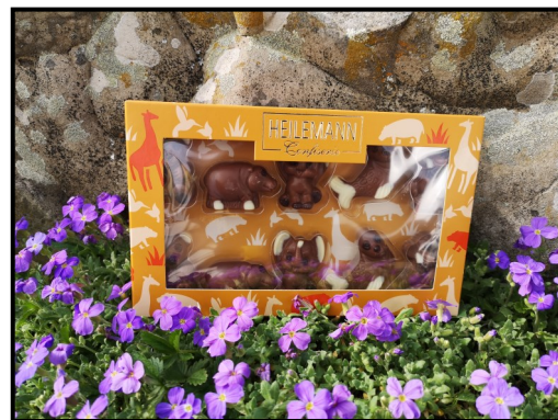
Pour les garçons