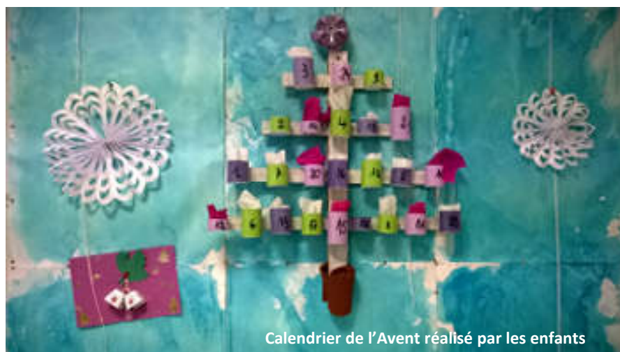
Calendrier de l'Avent réalisé par les enfants