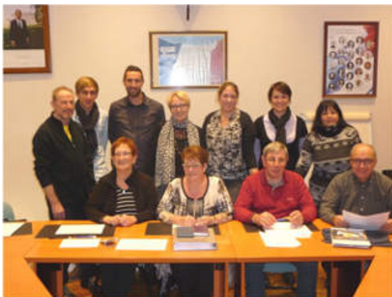
Fête patronale : réunion pour le partage des bénéfices de la fête