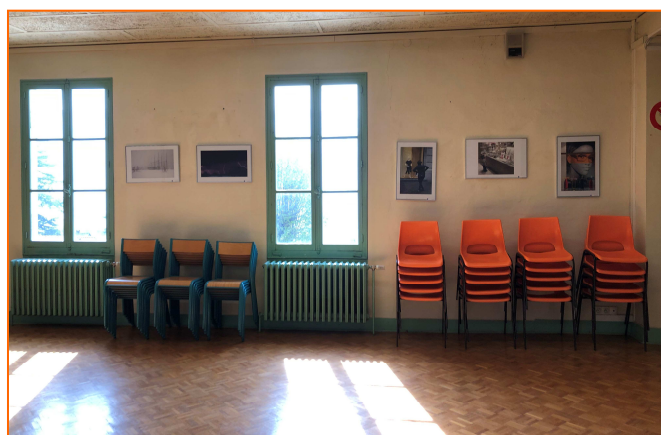
Rangement des chaises après utilisation