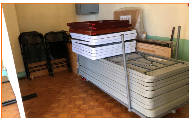
Rangement des tables et chaises noires