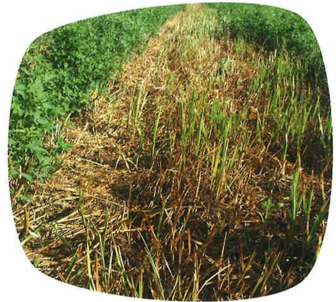
Repousse du souchet après une sécheresse