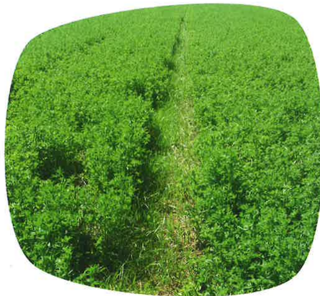
Rond de souchet dans une luzerne mal implantée