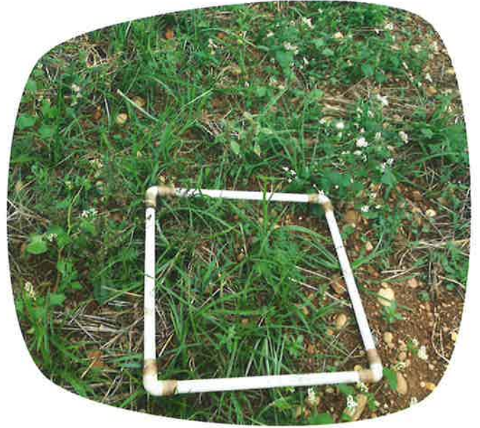
Présence du souchet dans une CIPAN