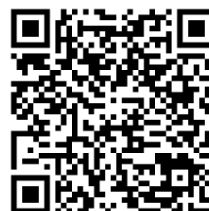
QR CODE ANDROID