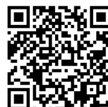
QR CODE APPLE

Une fois sur l'application, vous n'aurez plus qu'à sélectionner le réseau "LA ROSIERE".