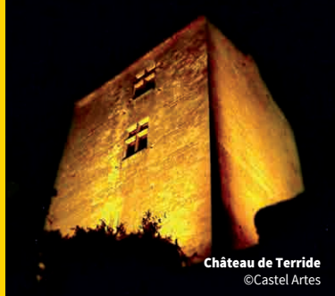
Château de Terride