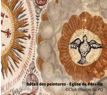
Détail des peintures - Eglise de Pérelle