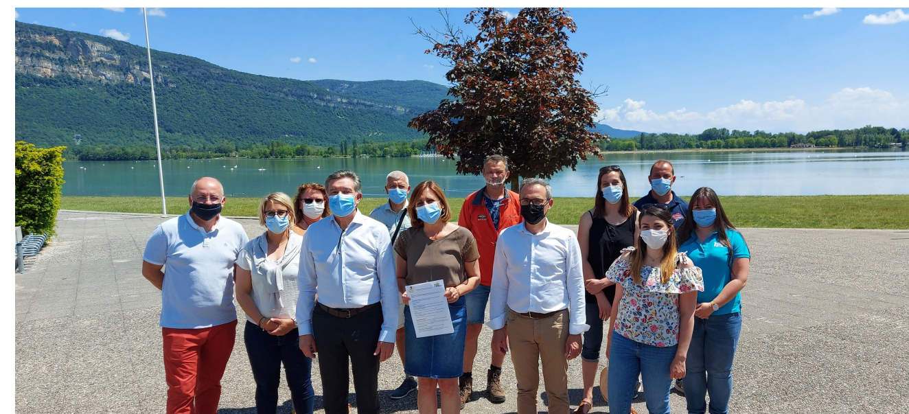
L'ensemble des Élus, des responsables de l'Office de Tourisme Intercommunal et les responsables de la Vallée Bleue.