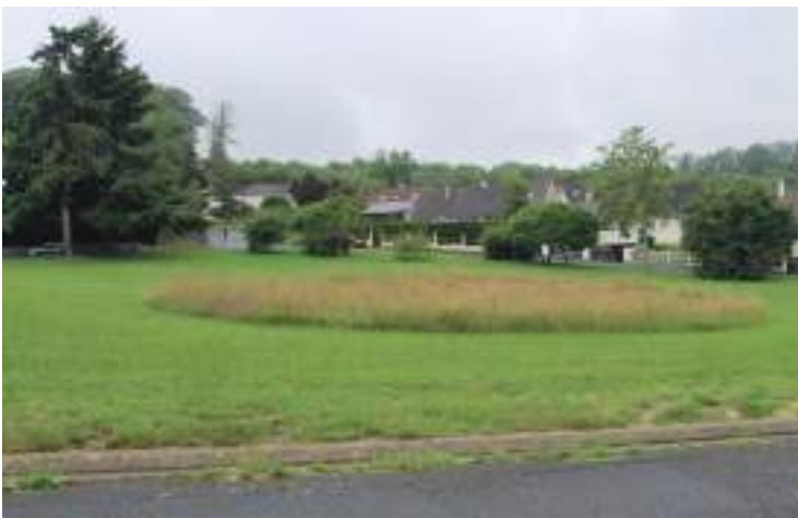
Le rond-point rue du Porc-Épic questionne avec sa surface «sauvage». Dans ce cercle d'herbes hautes, la faune y trouve gîte et couvert.

Le parc de l'Aleu invite à la promenade, tout en préservant la biodiversité. Les berges restent des refuges pour la flore et la faune, à l'image des surfaces du parc non tondues.