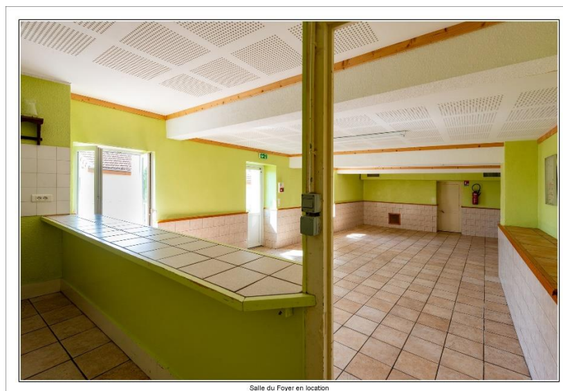
Salle du Foyer en location

Pour tout renseignement et réservation, contacter Michèle RELAVE au 04 77 20 83 57.