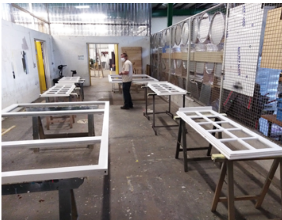
Les services techniques à pied d'œuvre.

Comme chaque été, les services techniques de la Ville vont mettre à profit les vacances scolaires pour engager des travaux d'entretien et de remise à niveau dans les écoles de Pont-à-Mousson. Exemple à Saint-Charles.