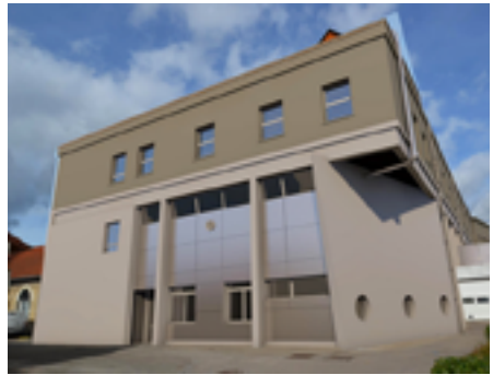
Restructuration de l'accueil des Urgences.

En 2020, une première étape a consisté à intégrer l'activité de Biologie Délocalisée, ce qui a contribué à réduire de près de 40 minutes le temps de passage aux urgences. Depuis, deux autres phases de travaux ont été lancées. La première achevée début juin a permis de créer deux chambres supplémentaires et une salle de bain pour le service. La seconde phase qui est coordonnée au calendrier du chantier de l'IRM aboutira à la rénovation de 170 m 2 , avec création du box d'accueil, du bureau médical et paramédical de l'équipe ainsi que de chambres de garde.