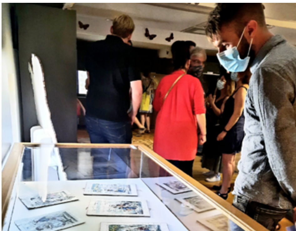
Exposition « L'imagerie mussipontaine au service de l'enfant ».

Le Musée mussipontain lance sa saison avec une exposition sur l'imagerie populaire au service de l'enfant. Comme un bain de jouvence !