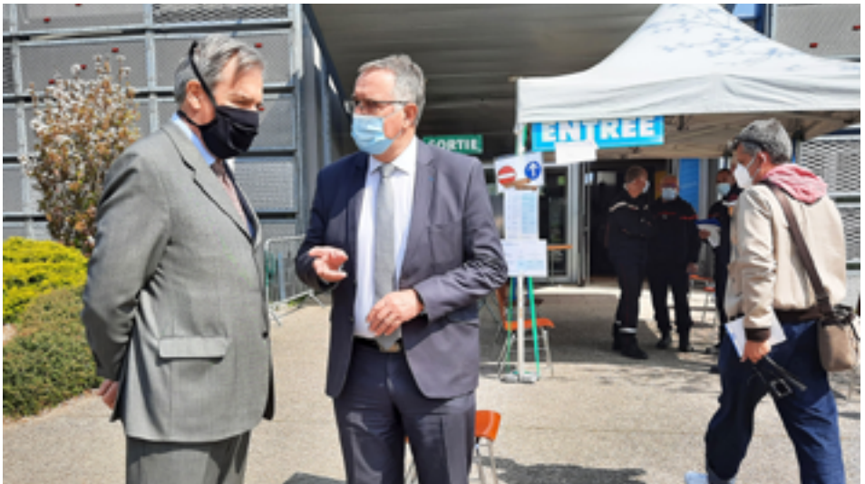
Echanges entre M. Le Préfet et M. Le Maire.

En visite à Pont-à-Mousson, le Préfet de Meurthe-et-Moselle a fait un détour par l'Abbaye des Prémontrés, site pressenti par Bruxelles pour accueillir des rencontres de dirigeants européens en 2022.