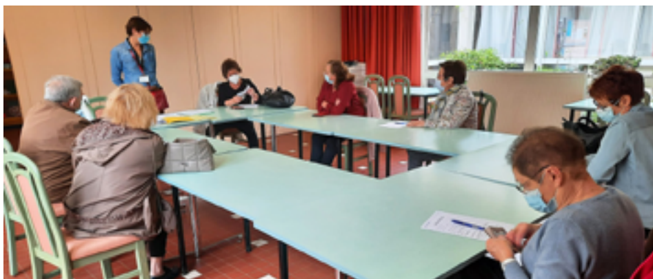
Inscriptions des seniors pour le voyage d'automne.

Particulièrement mobilisé pendant la pandémie, le Centre Communal d'Action Sociale a redoublé d'efforts pour porter secours aux Mussipontains en difficulté.