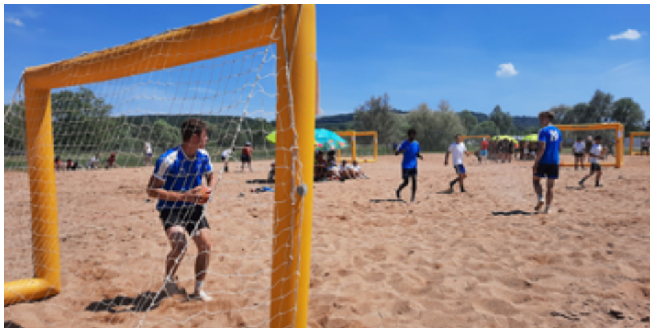
Le traditionnel Sand Pam au Grand Bleu.