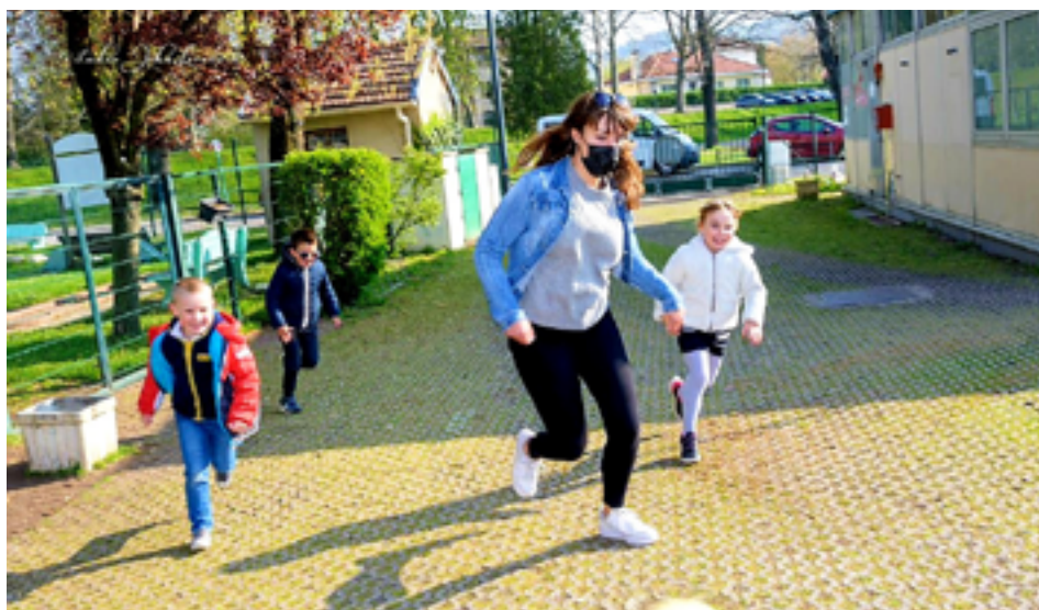
Des animations au Club de l'Amitié pour l'accueil des enfants des personnels prioritaires.

Un chantier emblématique se prépare sur l'Île d'Esch où le club de l'Amitié emménagera début 2022 dans un tout nouveau bâtiment construit sur pilotis.