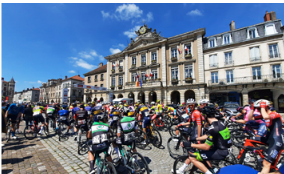
Départ du Tour de la Mirabelle à Pont-à-Mousson, le 28 mai.

Pour les clubs, la reprise s'est faite en ordre dispersé. Mais tous se sont donné rendez-vous à la rentrée pour une Fête du sport qui entend bien tourner définitivement la page du COVID.