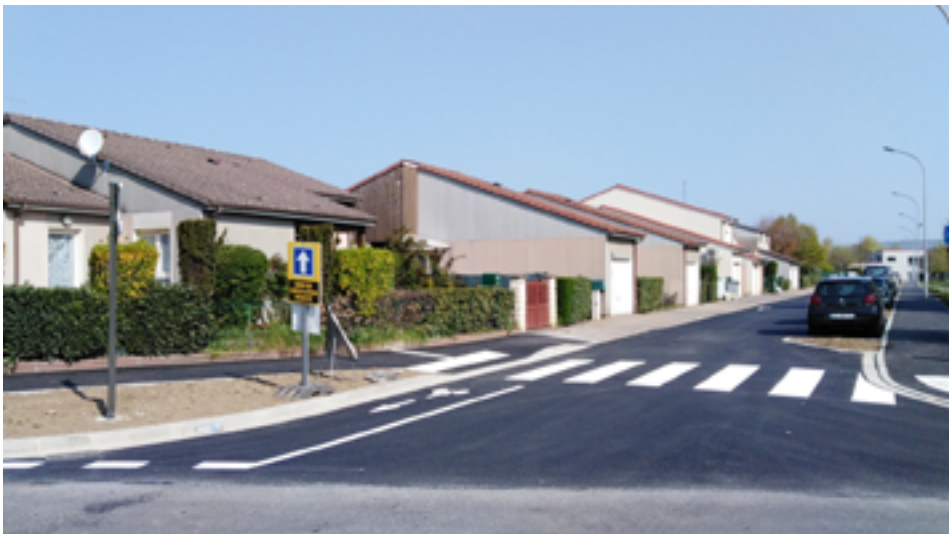
Rue Jean Mermoz après travaux.

Coup de jeune pour la rue Jean Mermoz et le chemin Saint-Michel, où les travaux de voirie ont permis d'améliorer la sécurité et l'accessibilité.