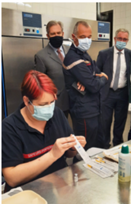
Avec le vaccinodrome Jean Prouvé de Nancy, l'Espace Montrichard a pu rendre service à de nombreux habitants de la Meurthe-et-Moselle et des départements voisins.

La mobilisation de la Ville et des acteurs de santé a permis à Pont-à-Mousson de disposer dès la mi-mars d'un centre de vaccination XXL où ont été réalisées plus de 33 000 injections en trois mois.