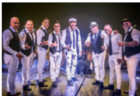
Salsa du démon, Septeto Nabori.