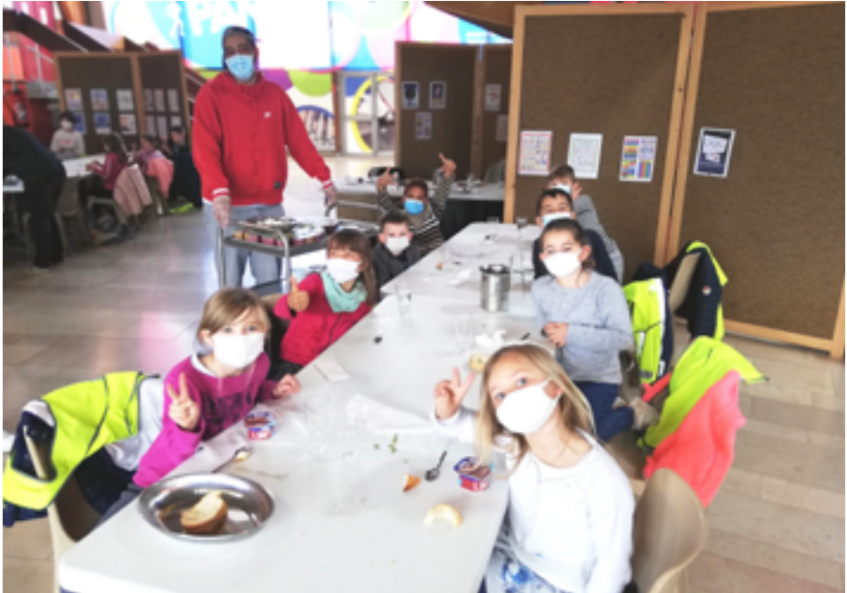
Restaurant scolaire au Centre des Sports.

Trois lieux de restauration scolaire au lieu de deux : durant les deux derniers trimestres de l'année scolaire, une partie des écoliers mussipontains a été accueillie au Centre des Sports. Une relocalisation provisoire réussie.