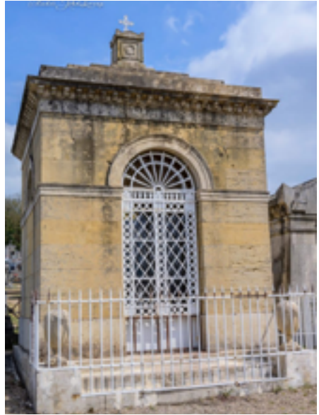
Le caveau où repose le cœur de Duroc.