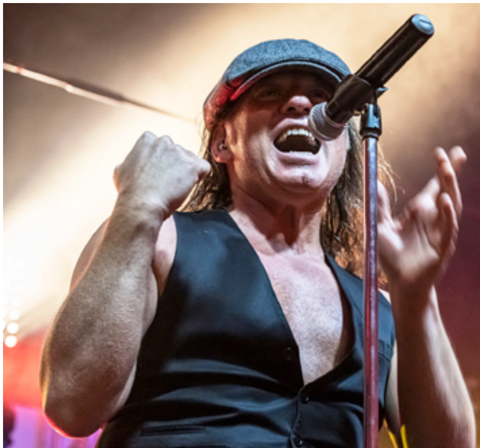
Rock Légends expérience, le 21 août.