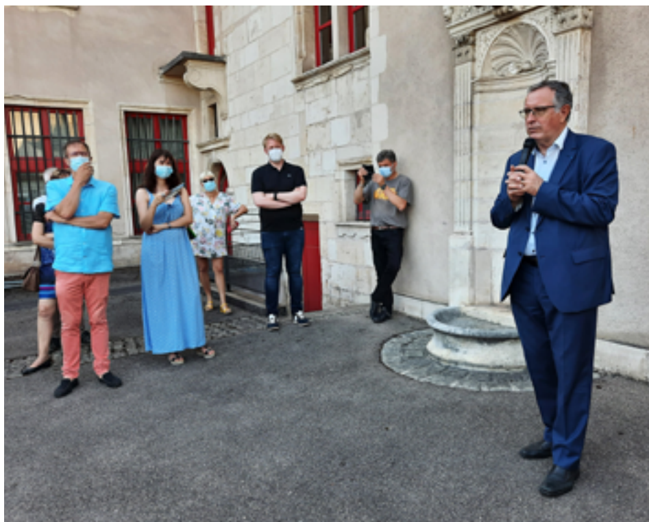
Discours officiel de M. Le Maire pour le premier vernissage de l'année.