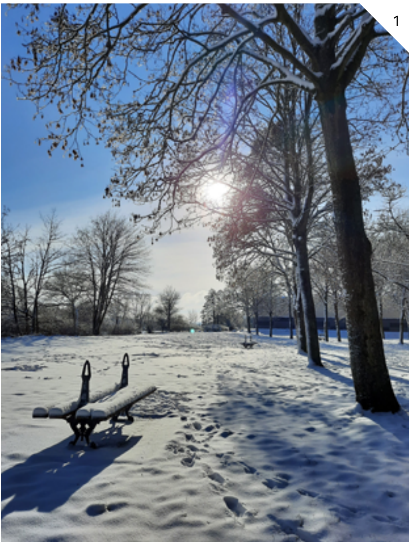
1 | Pont-à-Mousson sous la neige.

Tours, détours et retours en images sur les événements qui ont marqué la vie de notre commune au cours des six derniers mois.