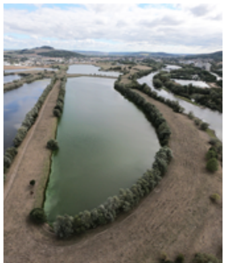
Emplacement du futur bassin d'aviron.

la réhabilitation des logements. S'adressant au Préfet, le Maire a tenu un discours d'exigence et appelé de ses vœux le soutien des services de l'État pour tous les chantiers que la Municipalité compte engager en réponse aux attentes et aux préoccupations des Mussipontains.