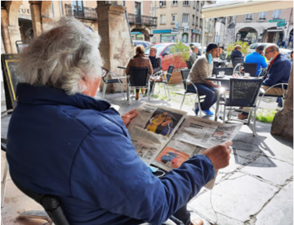
Réouverture des terrasses, le 19 mai.

Pendant la pandémie, Pont-à-Mousson a multiplié les initiatives en faveur du commerce local. Un accompagnement qui contribue au redémarrage économique et au rebond de la consommation.