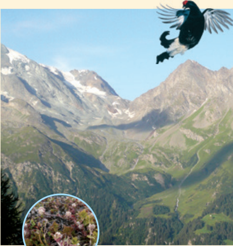
Trèfle des rochers