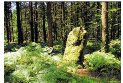
• Menhir de Men-Bihan.