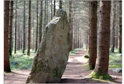
• Menhir de Men-Vras.