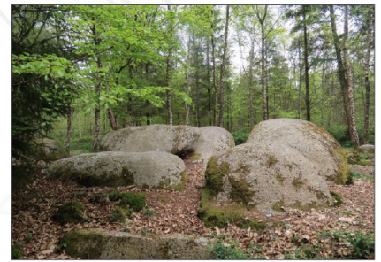
• Alignement de Cornevec.

C'est le moyen de faire connaître le patrimoine archéologique de notre territoire, le préserver. C'est aussi valoriser les ressources auprès des jeunes pour conforter l'identité du territoire (ateliers, randonnées contées).