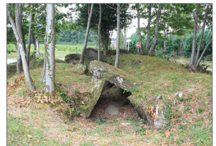
• Dolmen en allée couverte de Lann er Vein.