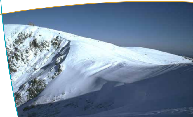
Le massif enneigé