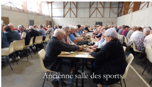
Ancienne salle des sports