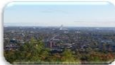
Vue de Montréal