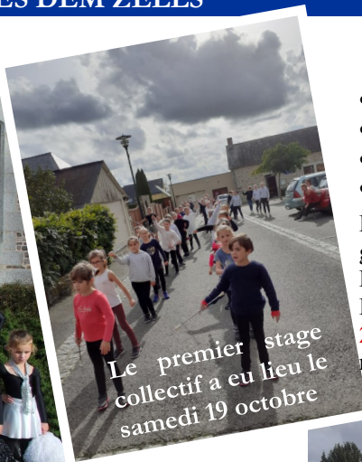
Le premier stage collectif a eu lieu le samedi 19 octobre

Nous avons 4 sorties de prévues pour la fin d'année :