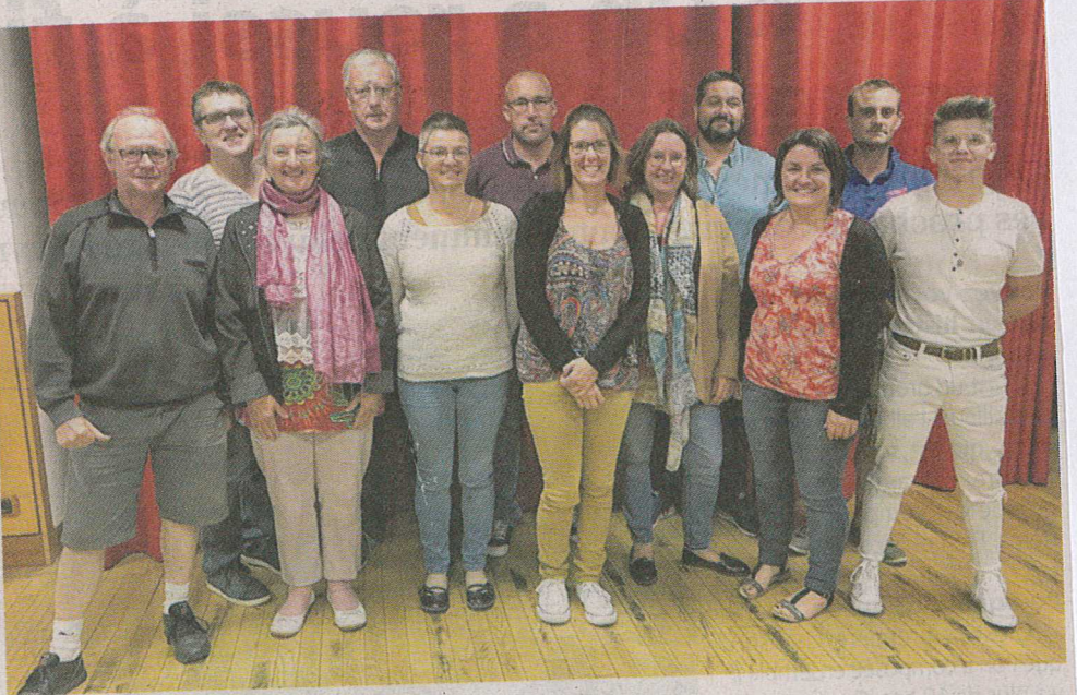
L'équipe de bénévoles du comité des fêtes

Pour cette édition exceptionnelle, le comité voit les choses en