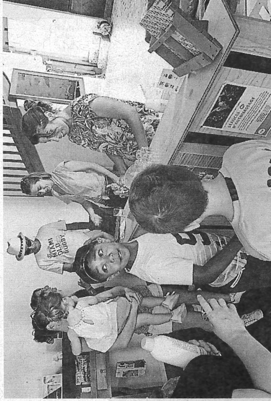
Dans la boutique, petits et grands ont pu faire leurs emplettes de produits locaux et artisanaux, mercredi.