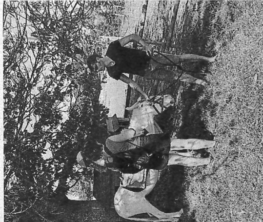
Les jeunes visiteurs ont pu bénéficier d'une promenade à dos d'ânesse.

Mercredis 31 juillet, 7 août et 21 août, à 11 h et 14 h 30. Sur réservation uniquement, auprès de l'office de tourisme du pays de Vitré, au 02 99 75 04 46. Tarifs : 2 € par personne (à régler au producteur, sur place) ; gratuit pour les moins de 2 ans.