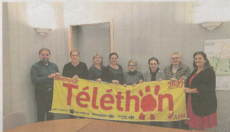
Les organisateurs et les musiciens règlent les détails de la soirée

L'ancienne salle de sport accueillera deux temps forts. À partir de 20 h, un repas préparé par le restaurant local La Belle Étoile. Mais aussi, ambiance musicale assurée par le duo Ci Git Cale, de Châteaubriant, dont le répertoire puise dans la country et la soul. Puis, à 22 h 30, place à la danse avec le groupe Big Box de Nantes.