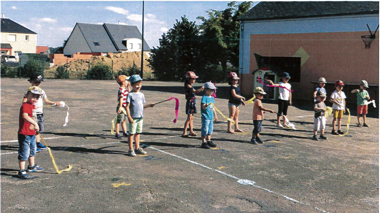
Les enfants, en pleine activité au centre de loisirs.