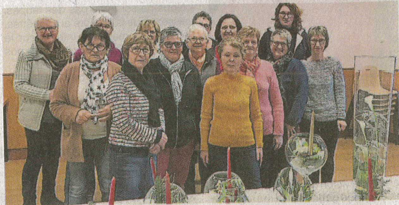
Le groupe de Noël et ses créations.