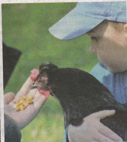
Le domaine propose un escape game en pleine nature et une découverte des animaux de la ferme

à destination des 6 à 12 ans, qui pourront s'inscrire pour un cycle de trois séances consécutives ou à l'année. Un thème différent sera abordé chaque mercredi.