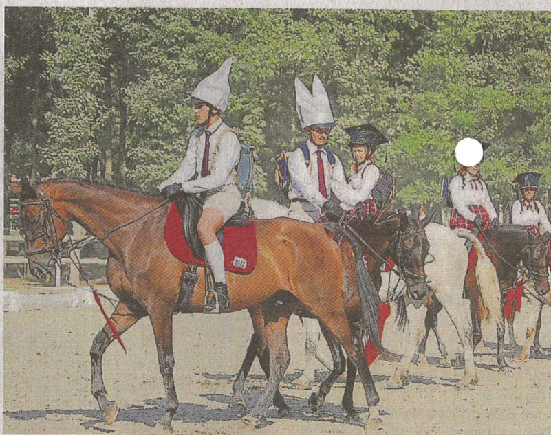
L'équipe du domaine de la Haute-Hairie décroche l'argent à l'épreuve de carrousel des championnats de France d'équitation clubs.