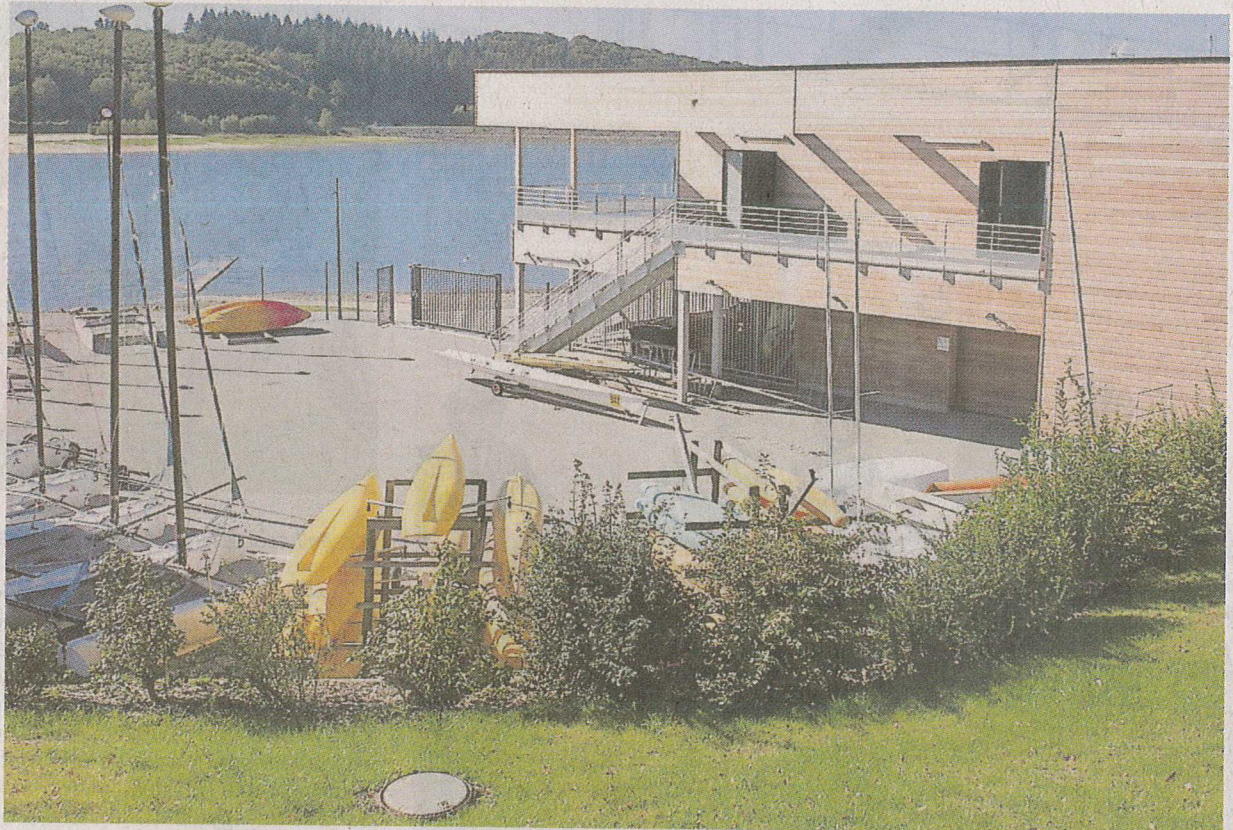
La base de loisirs de Haute-Vilaine à Saint-M'Hervé.