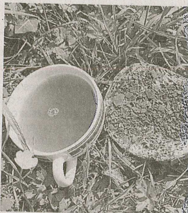
Les gourmandises de Tartines d'artistes.

Et comme toujours, les Vieux Volants vitréens sortiront leurs voitu-