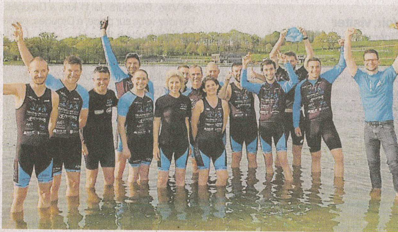
Les membres du club triathlon Vitré se mobilisent pour la journée du 26 mai.

Dimanche 26 mai, les triathlètes vont nager, rouler à vélo et courir à pied autour de la base de loisirs de Saint-M'Hervé.