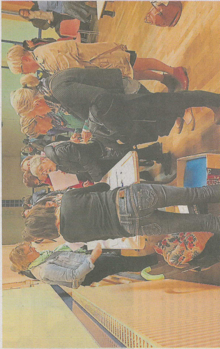
Les assistants maternels sont satisfaits de la création d'un Ripame, pour le secteur de Vitré nord et est.

Le Ripame a surtout l'ambition de professionnaliser et de valoriser le métier pour attirer de nouveaux assistants maternels. Ils sont de moins en moins nombreux dans le secteur, alors que la demande de garde est