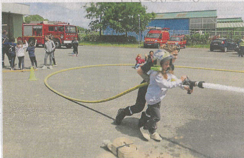
Les jeunes pompiers en action.