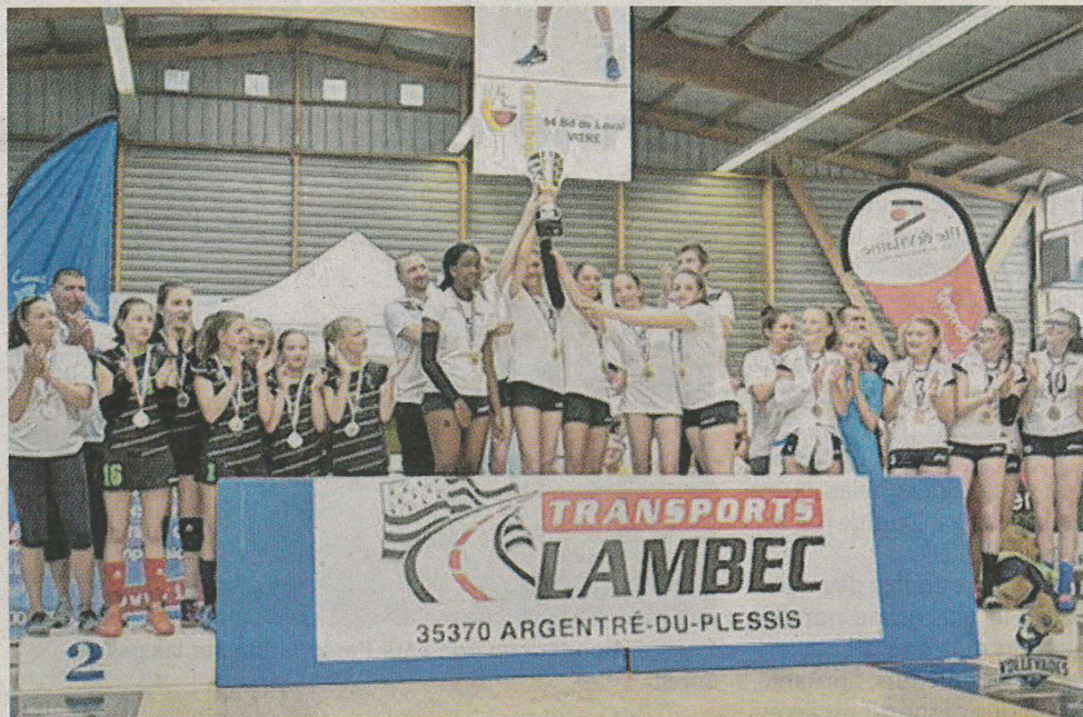
Le podium féminin de l'an passé

Les joueurs se retrouveront au collège d'Argentré-du-Ples-