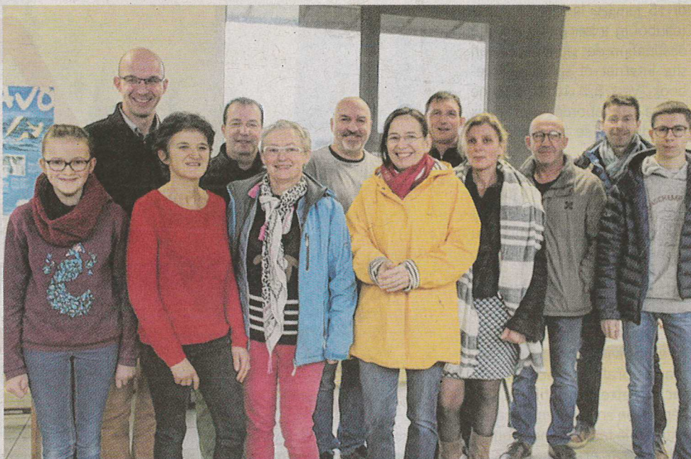
Les membres de l'ANCPV présents à l'assemblée générale