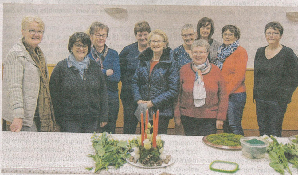
Une partie des membres de l'atelier d'art floral