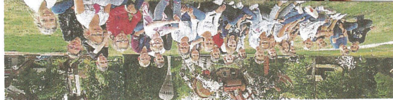
Les collégiens se posent des questions sur l'art