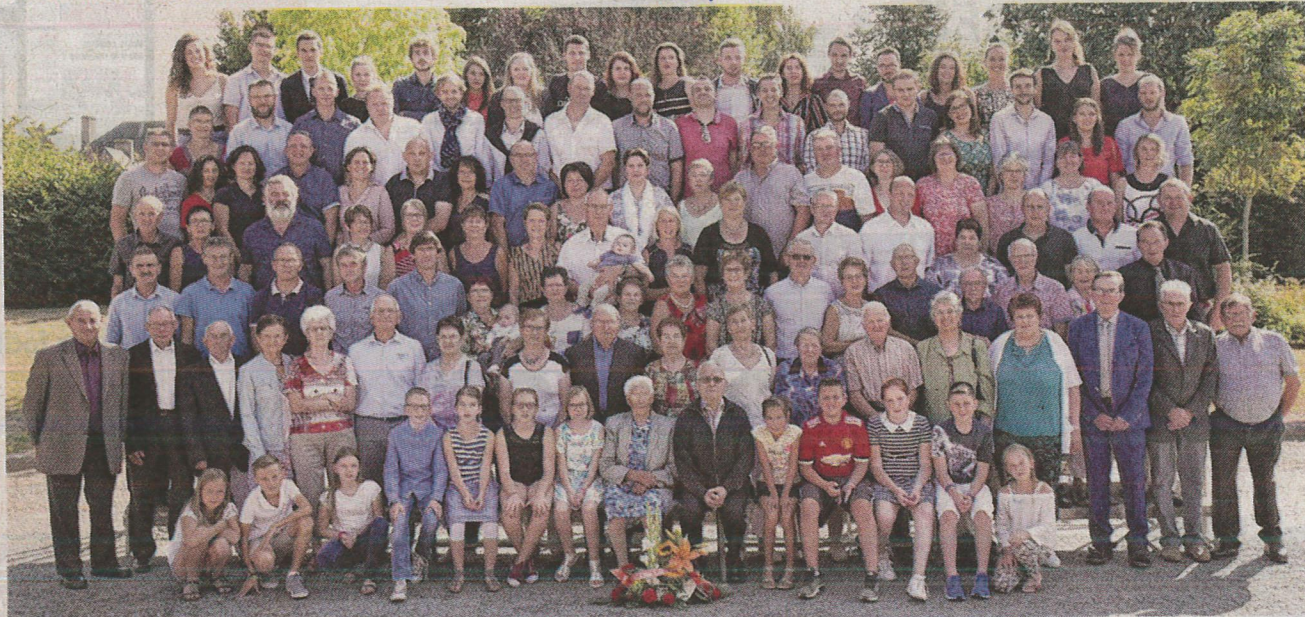
LES CLASSES 8 RÉUNIES. Toutes les générations de la commune se sont retrouvées samedi 1 er septembre. La photo des classes est disponible au Studio Maignan de Vitré au prix de 10 €.