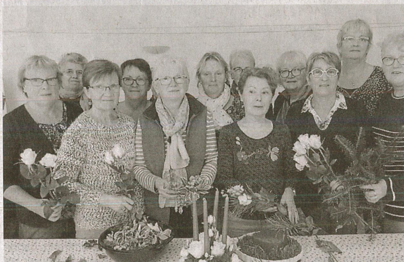
Des adhérentes se sont retrouvées pour faire une composition de fête, vendredi.