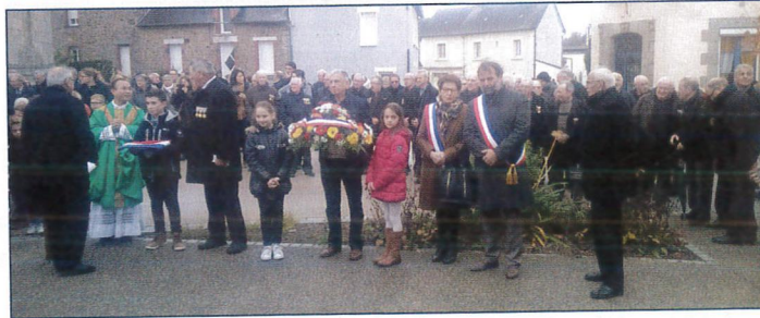
Rassemblement devant le monument aux morts

Au monument aux morts en présence de Saint-M'Hervé, l'assistance nombreuse a prouvé l'attachement de tous au travail de mémoire envers les jeunes générations. Notre reconnaissance aux combattants de 1914-1918, les Poilus qui se sont battus pendant quatre ans dans des conditions horribles pour défendre notre pays. Pour rendre hommage aux 94 morts dont les noms figurent sur le monument ainsi que les blessés, à chaque nomination d'un des morts inscrits, une rose était déposée par un enfant. Après la montée des couleurs au son des clairons de Saint-M'Hervé, le dépôt de gerbe puis la lecture du message du président de la République par M me la maire. Pour tous ces morts, sans oublier ceux de 1939-1945, d'Indochine et d'Afrique du Nord, une minute de silence a été demandée suivie de l'émouvante sonnerie aux morts. Un poème a été lu par une enseignante, La Marseillaise et l'hymne européen, l'Ode à la joie, ont été chantés par les enfants. L'assistance s'est retrouvée autour du verre de l'amitié offert par la municipalité.