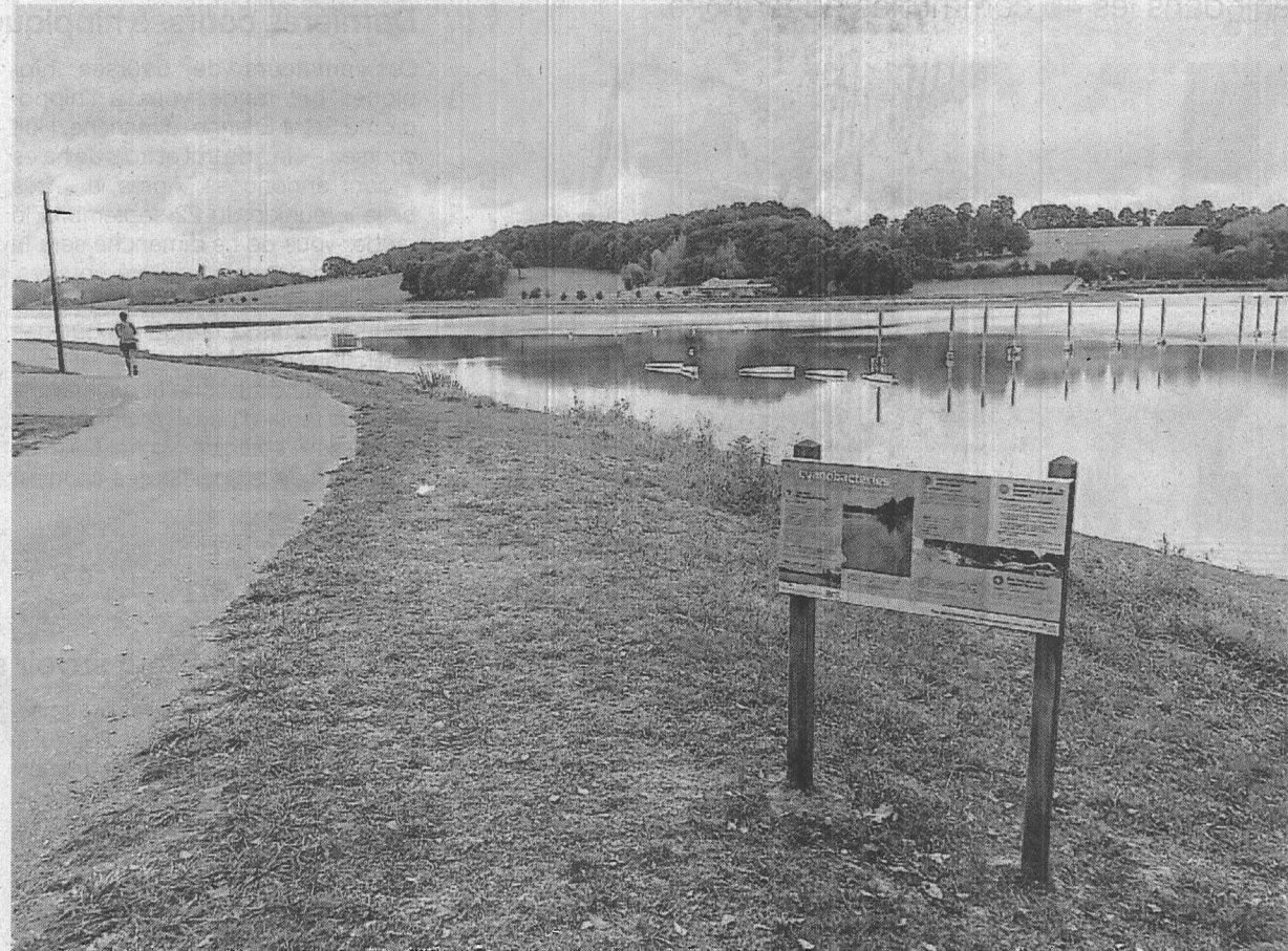
Aux beaux jours, les cyanobactéries se multiplient dans les plans d'eau, comme dans celui de Haute-Vilaine.

Pour eux aussi, « la vue de ces prairies noircies par ces boues donne une idée très mauvaise pour les randonneurs qui sont légion ». Et ils s'interrogent, en se demandant de quoi sont composées ces boues : « Que se passerait-il si elles ve-