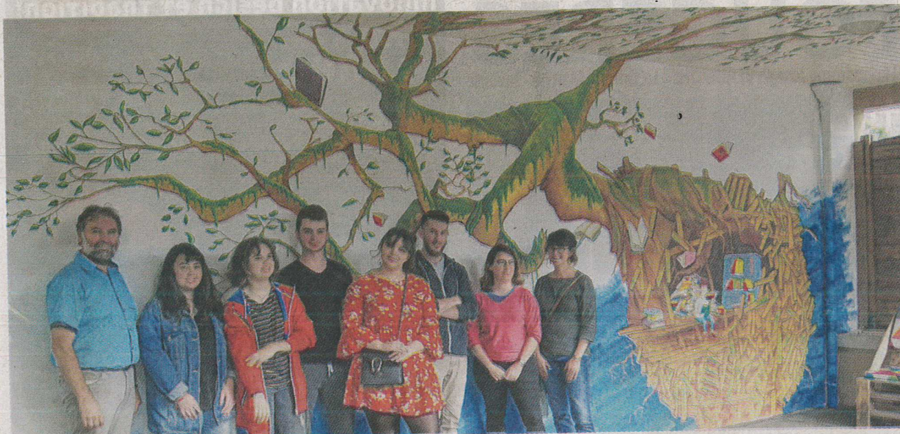
Les acteurs du projet devant la fresque

Jeudi 7 juin, les membres de la municipalité, du conseil municipal des jeunes, la proviseure, les enseignants et les élèves de la section Brevet des métiers d'Art du lycée la Champagne, s'étaient réunis pour inaugurer une fresque réalisée par le groupe d'étudiants.