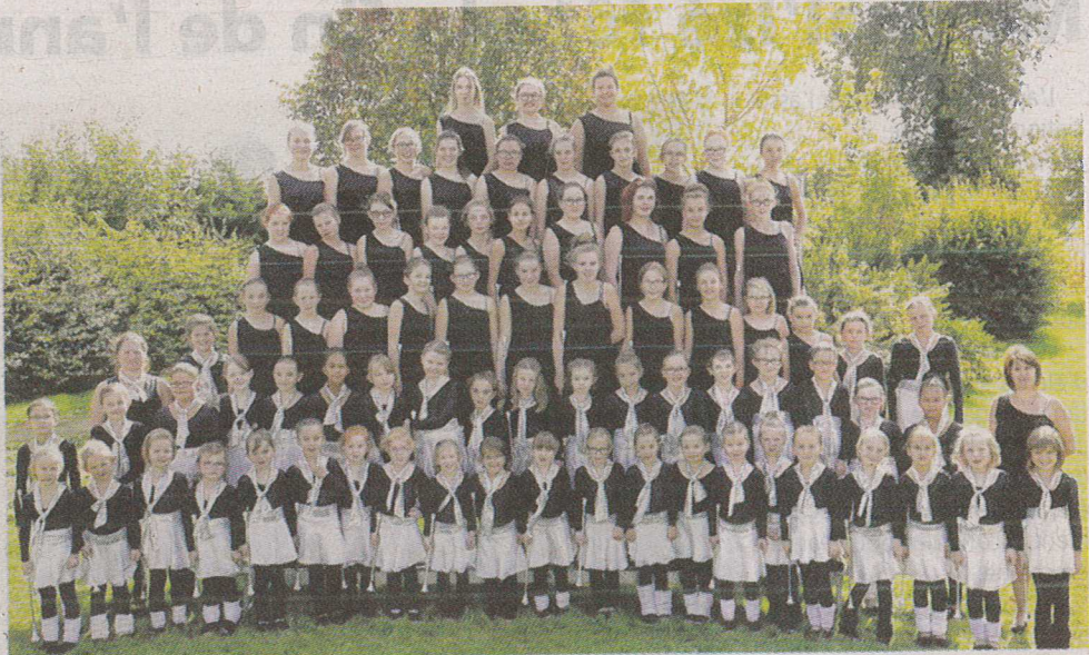
Les Dem'Zelles sont aujourd'hui 80 adhérentes

Se produisant actuellement à la salle des sports de la commune pour leurs galas, c'est avec enthousiasme que les majorettes préparent le spectacle d'anniversaire. La troupe bénéficiera