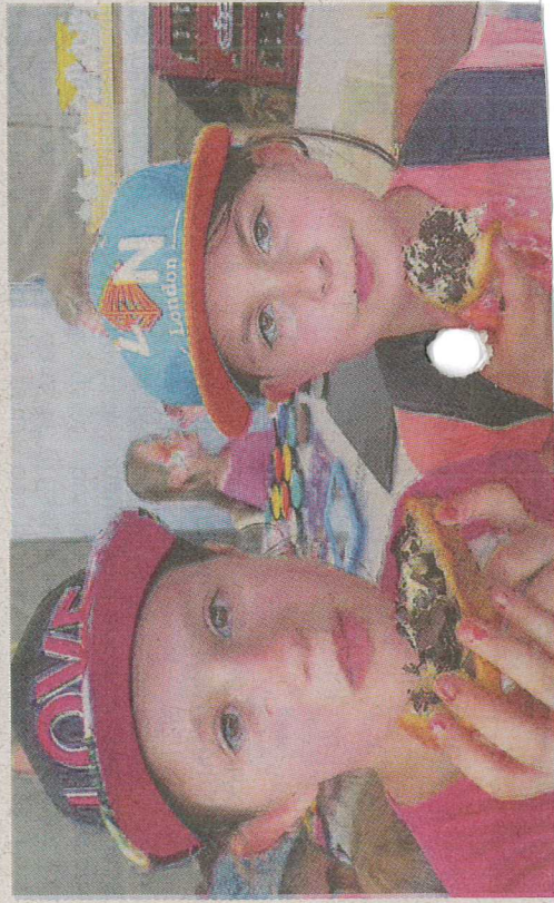
Après la marche le réconfort.

celui de la précédente édition, soit 1 700 personnes. En route maintenant pour l'édition 2019.