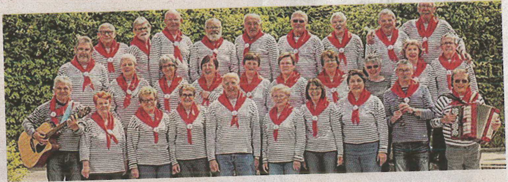
Le groupe Quai de l'Oust

Les marcheurs découvriront Ziko le magicien , Les bulleuses artistes de bulles gigantesques qui raviront les enfants ou encore Le bureau des pensées perdues , association artistique qui proposera sa vision du monde au travers de sculptures et spec-