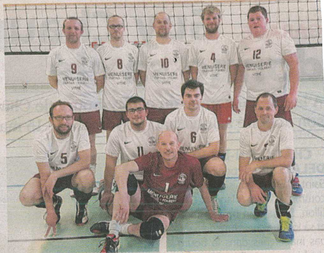
Un club dynamique qui termine la saison sur les chapeaux de roues avec l'organisation de plusieurs manifestations

Pour terminer en beauté, les 16 et 17 juin, le club participera aux mini volleyades (rencontre nationale des sélections M13) du Pays de Vitre, avec matches de qualification le 16 juin (matin) à Saint-M'Hervé. Les finales ayant lieu à l'Aurore de Vitre.