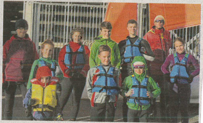
Les membres de l'école de sport lors de la fermeture du samedi 2 décembre

Les débutants sont accueillis en début d'après midi.