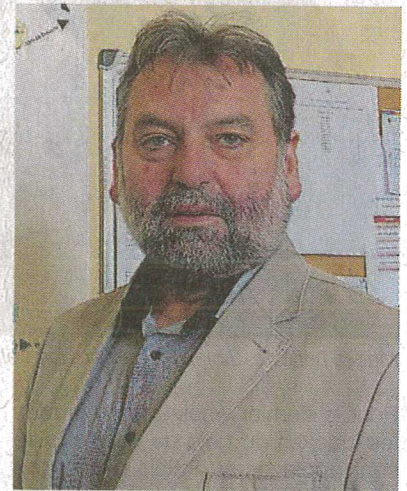
Dominique Kerjouan, maire.

Le projet de construction d'un centre de loisirs. Actuellement le centre de loisirs fonctionne dans les locaux de l'ancienne école, se développant le bâtiment n'est plus adapté aux réglementations et aux normes. Sa réhabilitation ne permettant pas de satisfaire aux besoins, le