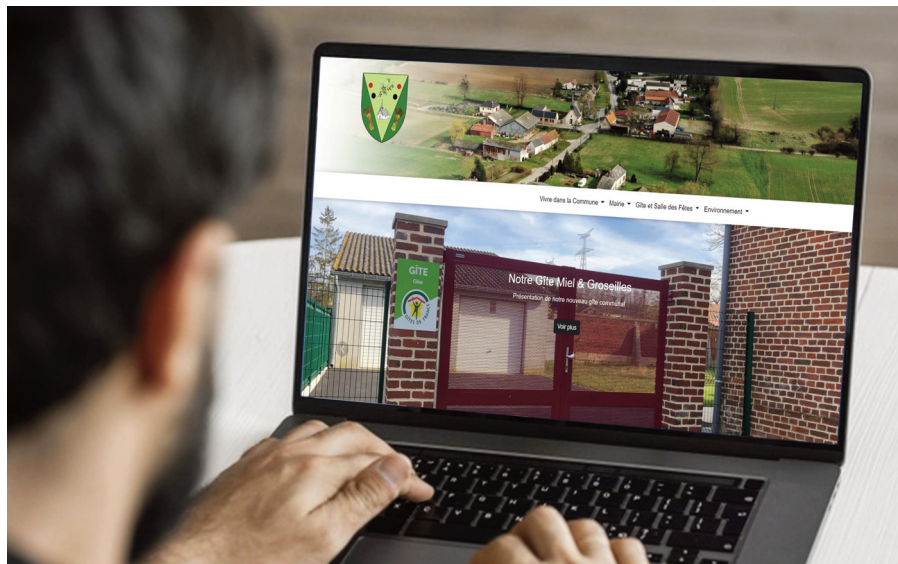
Site web de la commune de Gouy-les-Groseillers