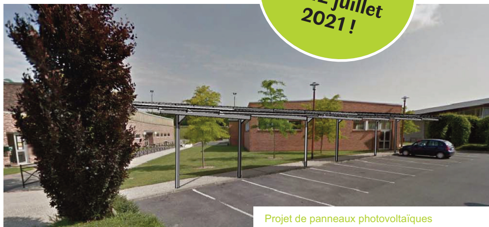
Projet de panneaux photovoltaïques

En parallèle, l'installation de panneaux photovoltaïques, environ 600 m 2 au niveau des parkings et sur le terrain enherbé à l'arrière du bâtiment, viendra compléter la démarche de développement durable engagée depuis de nombreuses années par la Communauté de Communes de l'Oise Picarde. En effet, au-delà de la chaleur assurée par la chaudière bois, cette installation devrait permettre de produire, et d'autoconsommer, environ 30% de l'électricité nécessaire au fonctionnement de la piscine !