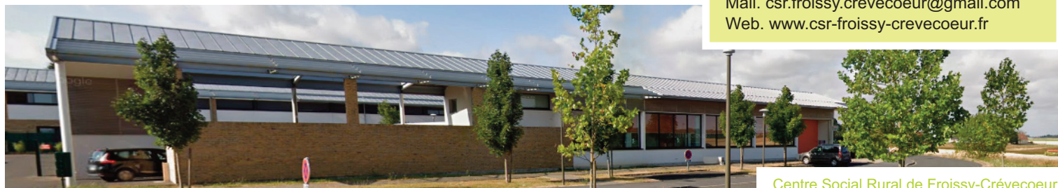
Centre Social Rural de Froissy-Crévecoeur

1 rue des Bouviers 60480 FROISSY Tel. 03 44 80 81 58 Mail. csr.froissy.crevecoeur@gmail.com Web. www.csr-froissy-crevecoeur.fr