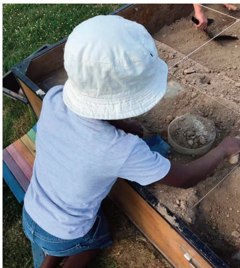
Atelier " L'archéologie, quel chantier "

Toutefois, le musée se trouve désormais un peu à l'étroit dans son bâtiment : les réserves sont pleines et il manque des espaces pour accueillir au mieux les visiteurs, comme une salle d'exposition permanente plus grande, une seconde salle de médiation ou encore un accueil pour les visiteurs individuels, qui souhaiteraient prendre du temps au calme, pour se restaurer ou encore consulter des ouvrages.