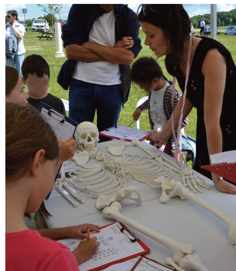
Atelier " Six pieds sous terre "

L'avenir du musée se dessine donc actuellement.