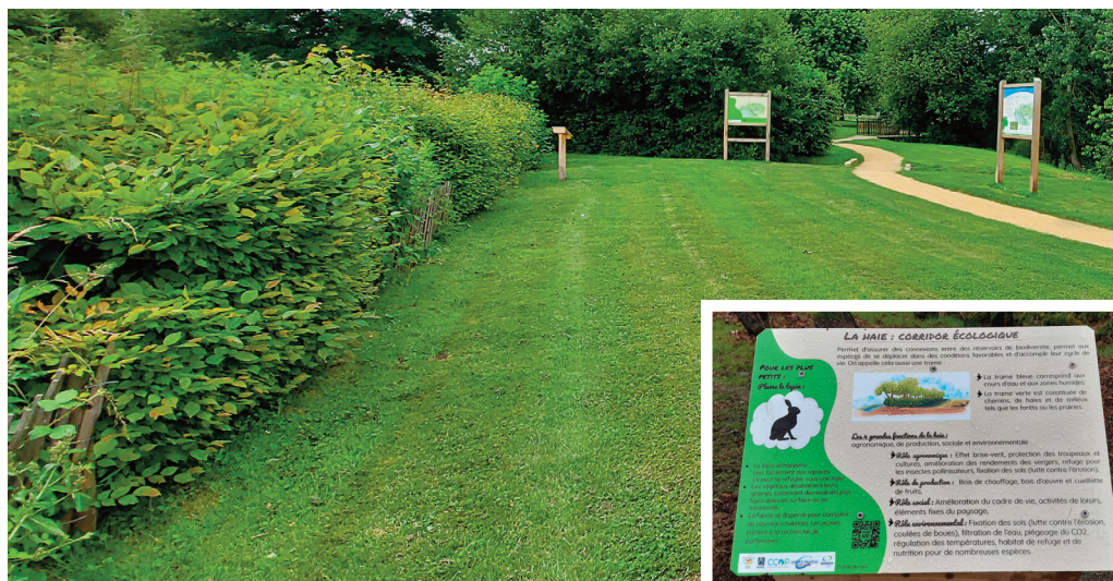
Panneau pédagogique à la zone humide de Breteuil : La haie: corridor écologique