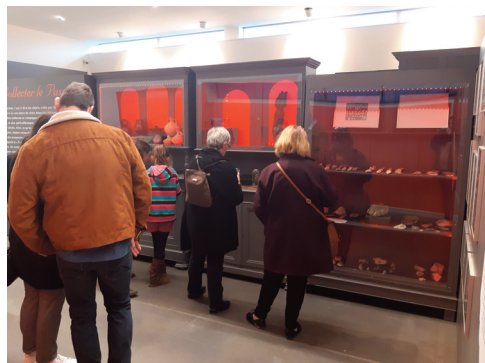
Exposition " Curieuses collections "

De nombreuses expositions ont eu lieu au cours de ses dix ans, chacune mettant en scène une ou plusieurs collections d'objets : les figurines de terre cuite retrouvées en 2015, le matériel des tombes gauloises, romaines et mérovingiennes ou encore l'archéologie vue par le dessin et la bande-dessinée. Le MAO prête d'ailleurs de nombreux objets et même ses expositions à d'autres établissements culturels. « Je suis archéologue », qui mêle illustrations humoristiques et archéologie passera ainsi l'été à la médiathèque de Saint-Amand -les-Eaux !