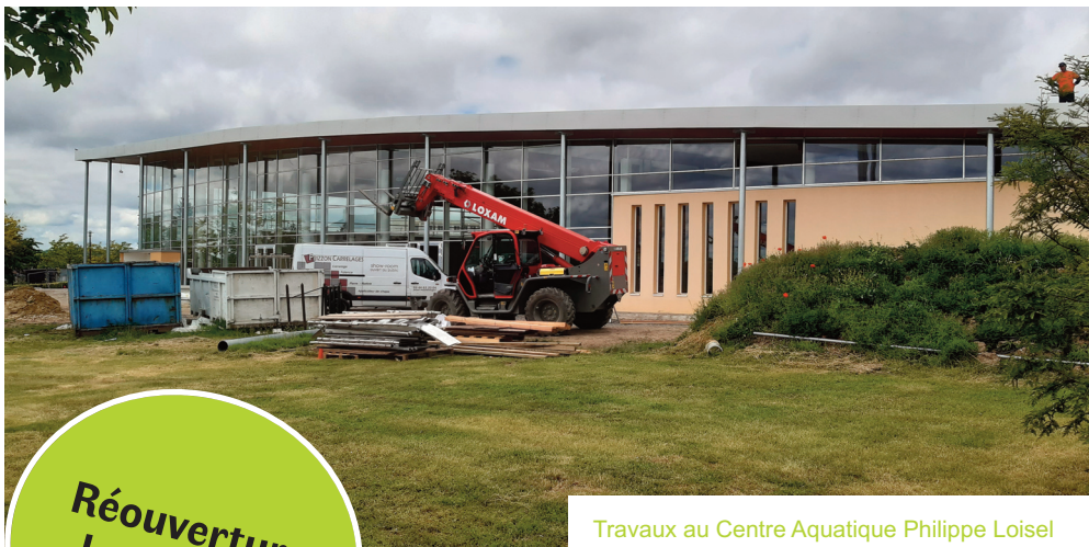
Travaux au Centre Aquatique Philippe Loisel

En seconde phase, le projet d'extension de l'espace Fitness se développe et suit son cours. Ces travaux d'agrandissement débuteront en fin d'année et ne nécessiteront pas la fermeture complète du Centre Aquatique. C'est donc une bonne nouvelle pour les usagers qui pourront continuer leurs activités !