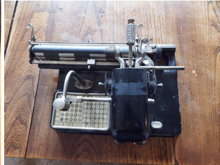
une machine à écrire