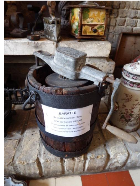
baratte pour produire du beurre