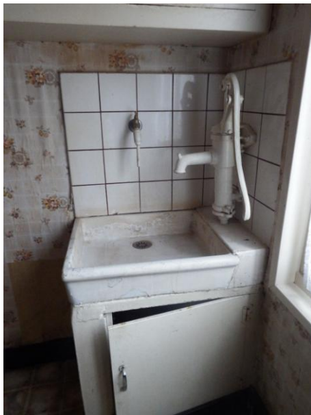
pompe à eau