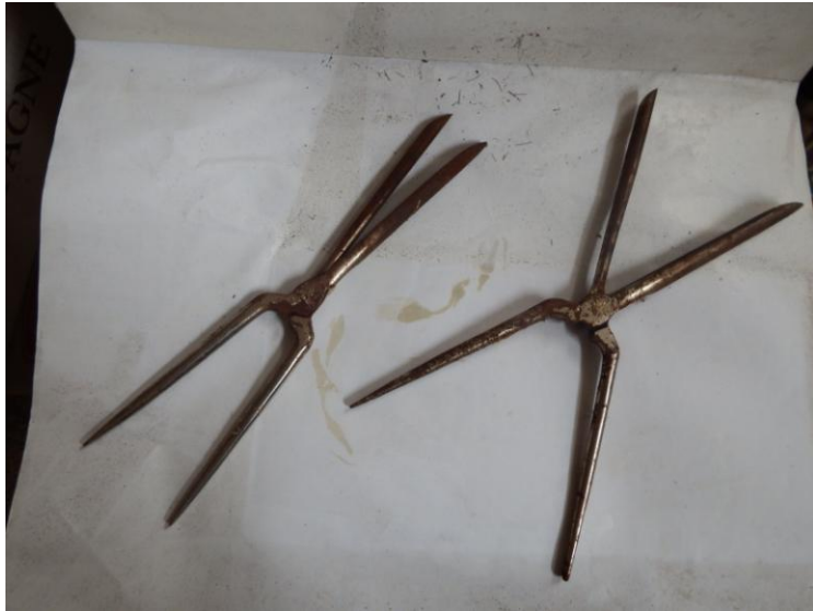
Fers à friser