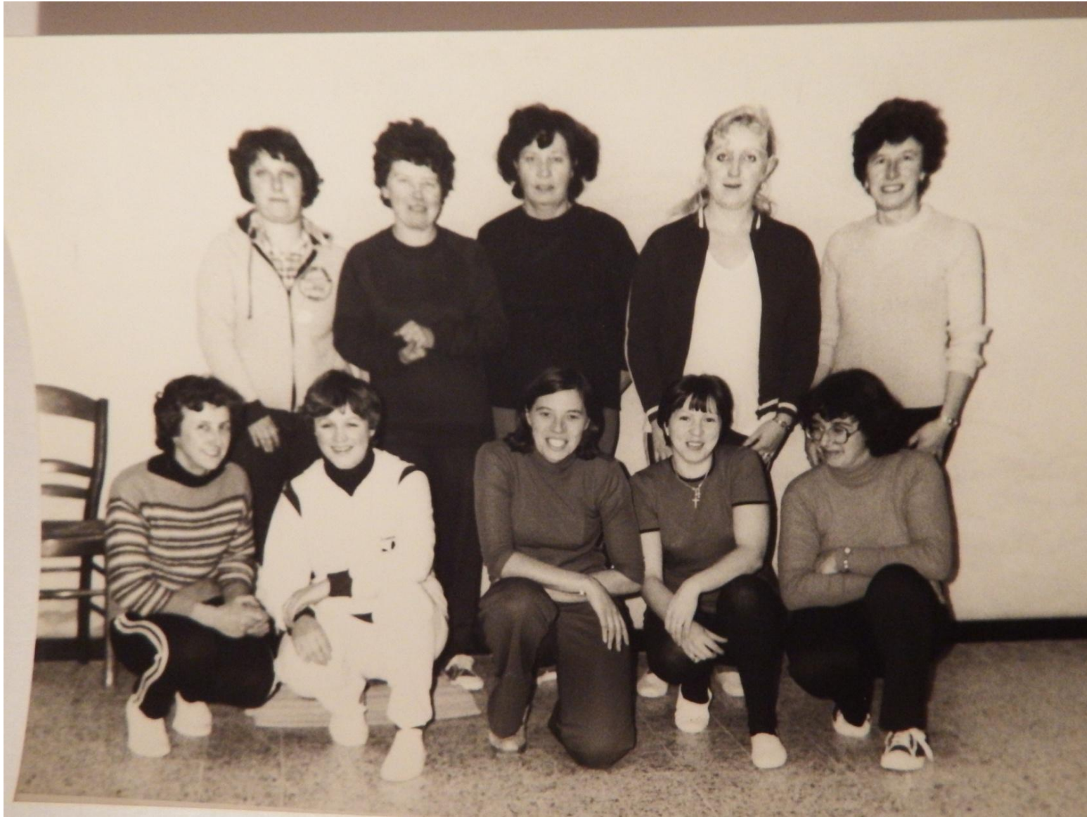
Club de gymnastique