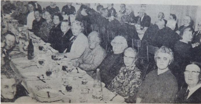
Quelques-uns parmi les 90 participants au premier banquet.