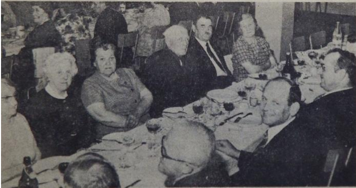
Le maire (premier plan à droite), a le sourire : ses convives sont satisfaits.