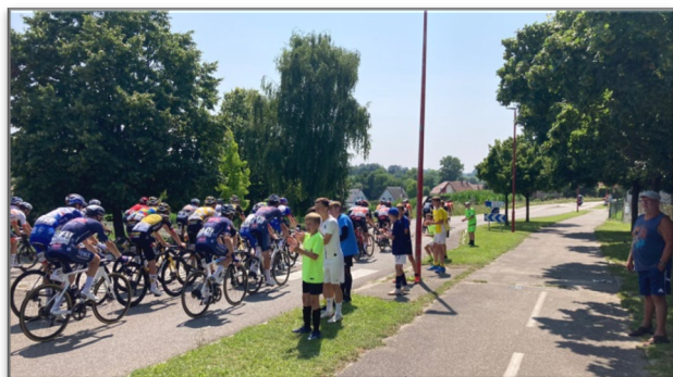
Nos jeunes ont encouragé les coureurs du Tour d'Alsace

Prochaines dates à retenir : (A confirmer selon l'évolution de la situation sanitaire) Dimanche 26 septembre : Carpes Frites au Dorfhus