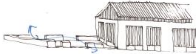
Démolition partielle avec conservation des arases ?