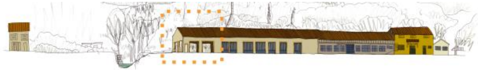
Hypothèses d'évolution du bâtiment