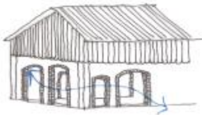
Conservation d'une halle ouverte sur la perspective de la cascade ?