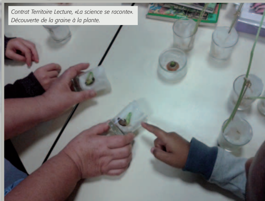
Contrat Territoire Lecture, «La science se raconte». Découverte de la graine à la plante.

Pendant toute la durée de l'animation, les bibliothécaires ont lu à tous les élèves des albums consacrés au thème des plantes.