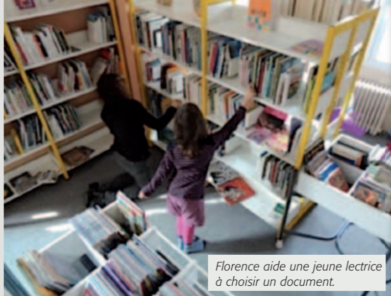
Florence aide une jeune lectrice à choisir un document.