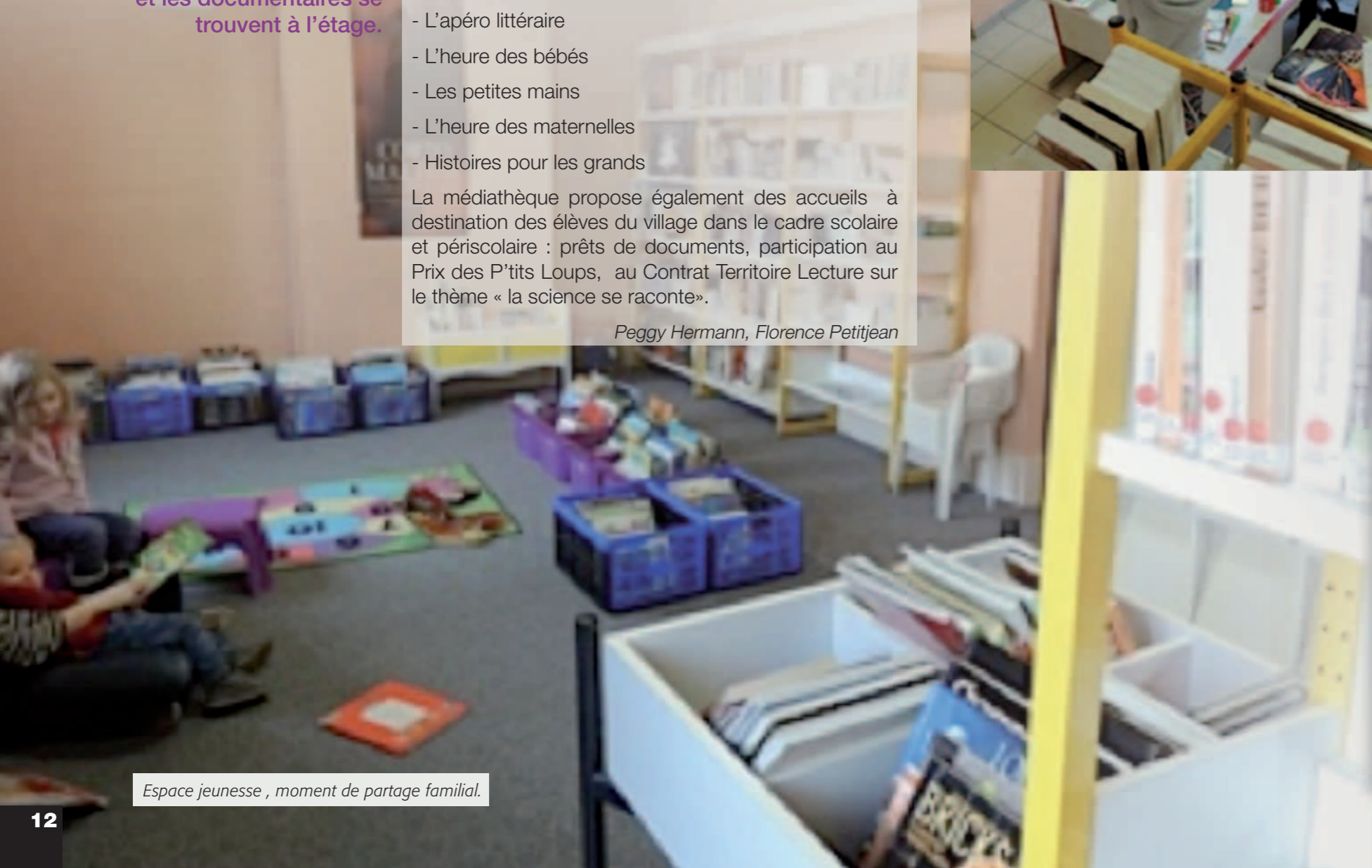
Espace jeunesse, moment de partage familial.