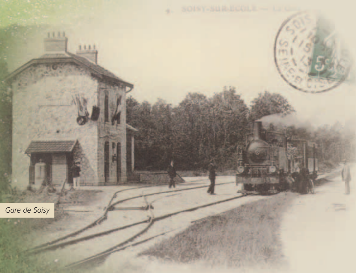
Gare de Soisy