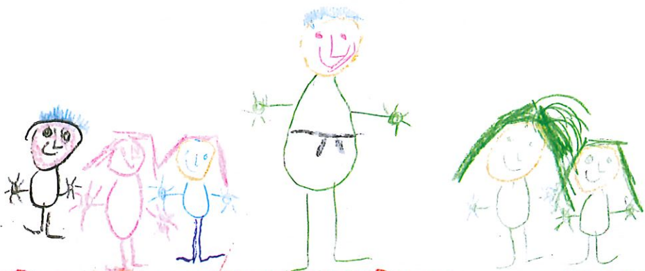
Baby Judo à St Jean de la Porte