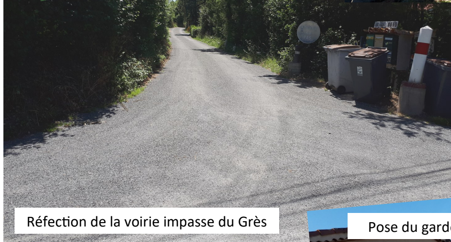
Réfection de la voirie impasse du Grès