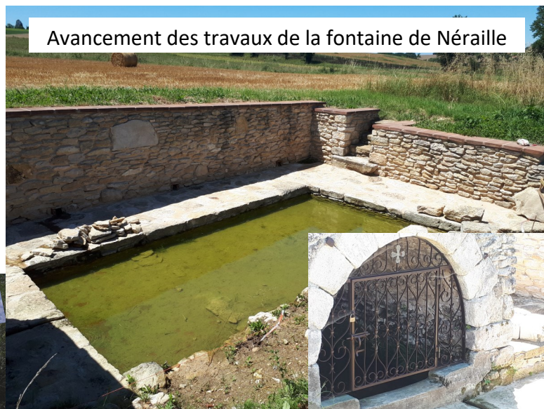
Avancement des travaux de la fontaine de Néraïlle