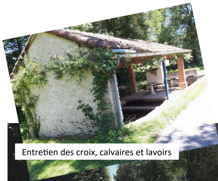
Entretien des croix, calvaires et lavoirs