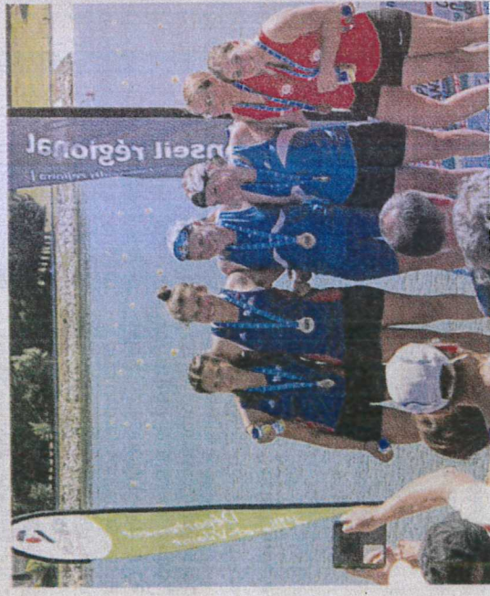
Le podium en C2 dames juniors 500m