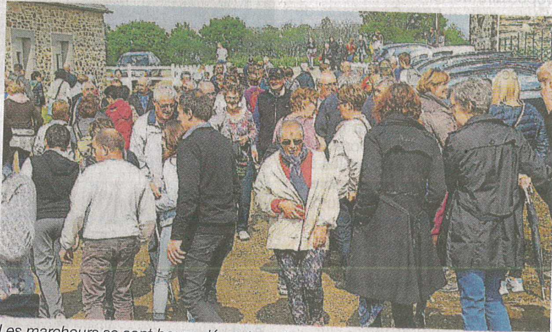
Les marcheurs se sont bousculés autour des fameuses tartines.

La renommée est installée depuis bien longtemps. En plus, le soleil était au rendez-vous. La 22 e édition des Tartines d'artistes a connu à nouveau le succès, dimanche 7 mai.