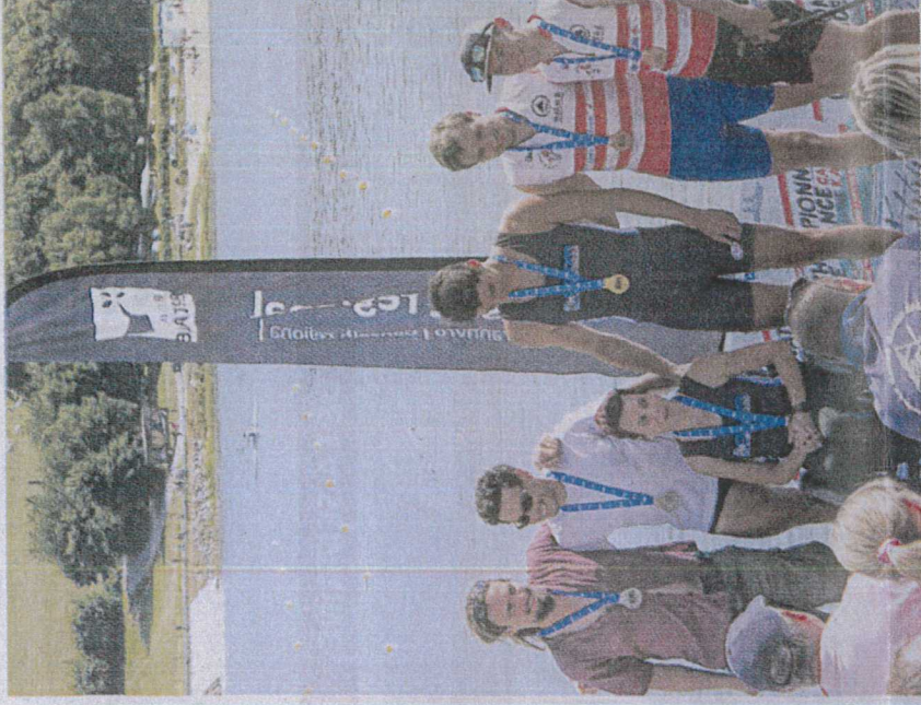
Une belle fraternité entre les champions, à l'image du podium en K2 paracanoë