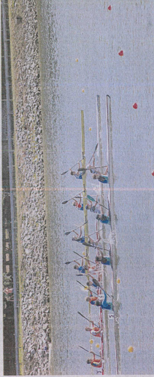
La compétition a bénéficié de conditions météo idéales durant cinq jours