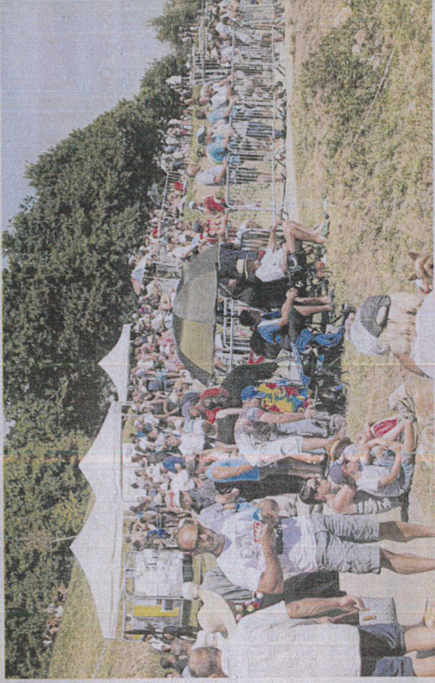
Curieux ou spécialistes, le public a répondu présent