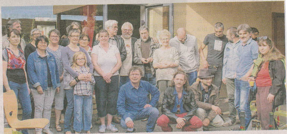
Les auteurs de BD ont rencontré leur public, à Saint-M'Hervé

Les visiteurs ont aussi pu visiter la bibliothèque. L'occasion de faire connaître ses fonds : beaucoup de bandes dessinées mais aussi des albums, documentaires, biographies, romans adultes et enfants, CD et