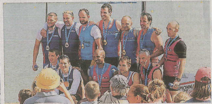
Visiteurs sont venus nombreux découvrir ce sport et la base de loisirs. Une partie du groupe de Malestroit. Une partie du groupe de Pontivy. Le podium du K4 Vitré (1 000 m).

clubs, on est de grands coureurs sur l'eau, où là, c'est le qui compte ! » Cette phrase du groupe de Malestroit résume bien l'esprit de ces championnats de vitesse de canoë-kayak. Ils ne sont pas à la base de Haute-Vilaine, les Morbihains se retrouvent à leur camp de football sur le terrain de foot de La Chabrière, où d'autres clubs bretons comme Pontivy - et le groupe de Malestroit de la région ont, eux aussi, planté leurs tentes.