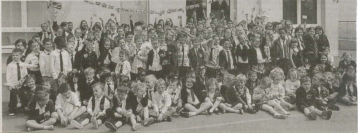
Une atmosphère « So British » appréciée de tous les écoliers de Sainte-Anne.

Les élèves de l'école Sainte-Anne se sont mis, la semaine dernière, à l'heure britannique le temps d'une journée. « Elle a débuté par l'Assemblée, ont expliqué les enseignantes. C'est-à-dire le rassemblement des élèves en uniforme dans la cour de l'école, et la présentation du programme. »