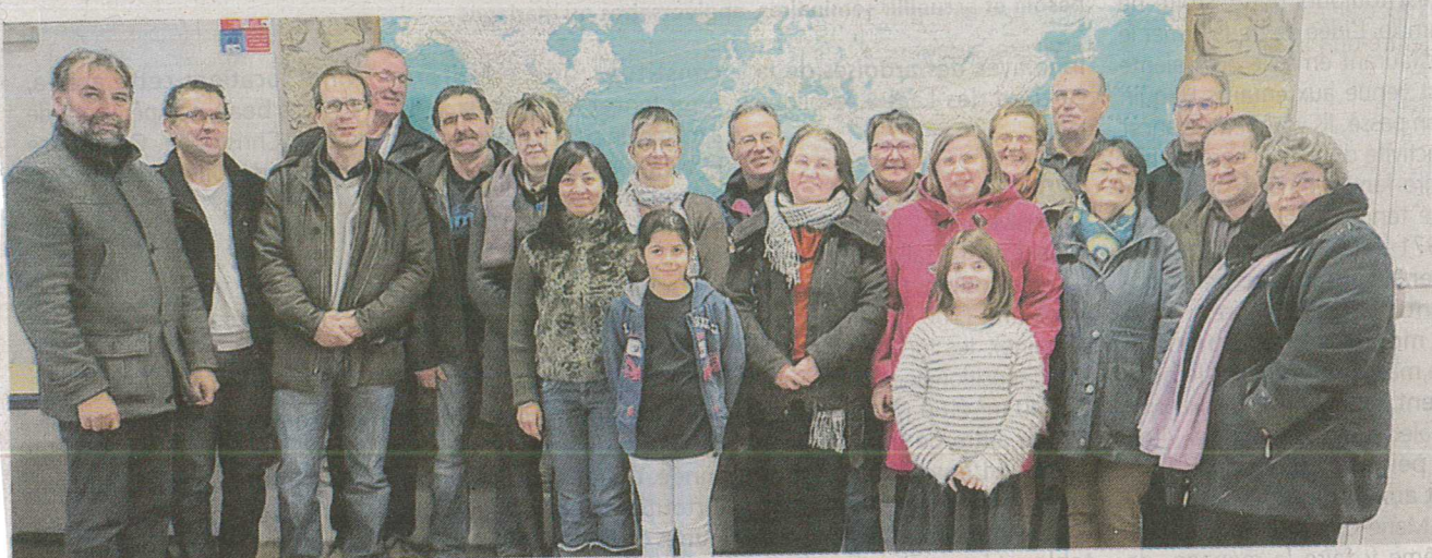
Vingt personnes se sont rassemblées à la salle communale Saint-Eloi

Samedi 14 janvier, vingt personnes se sont retrouvées à la salle communale Saint-Eloi de Saint-M'Hervé pour revitaliser des échanges déjà anciens de vingt années avec la commune de Princeville, au Québec. Des