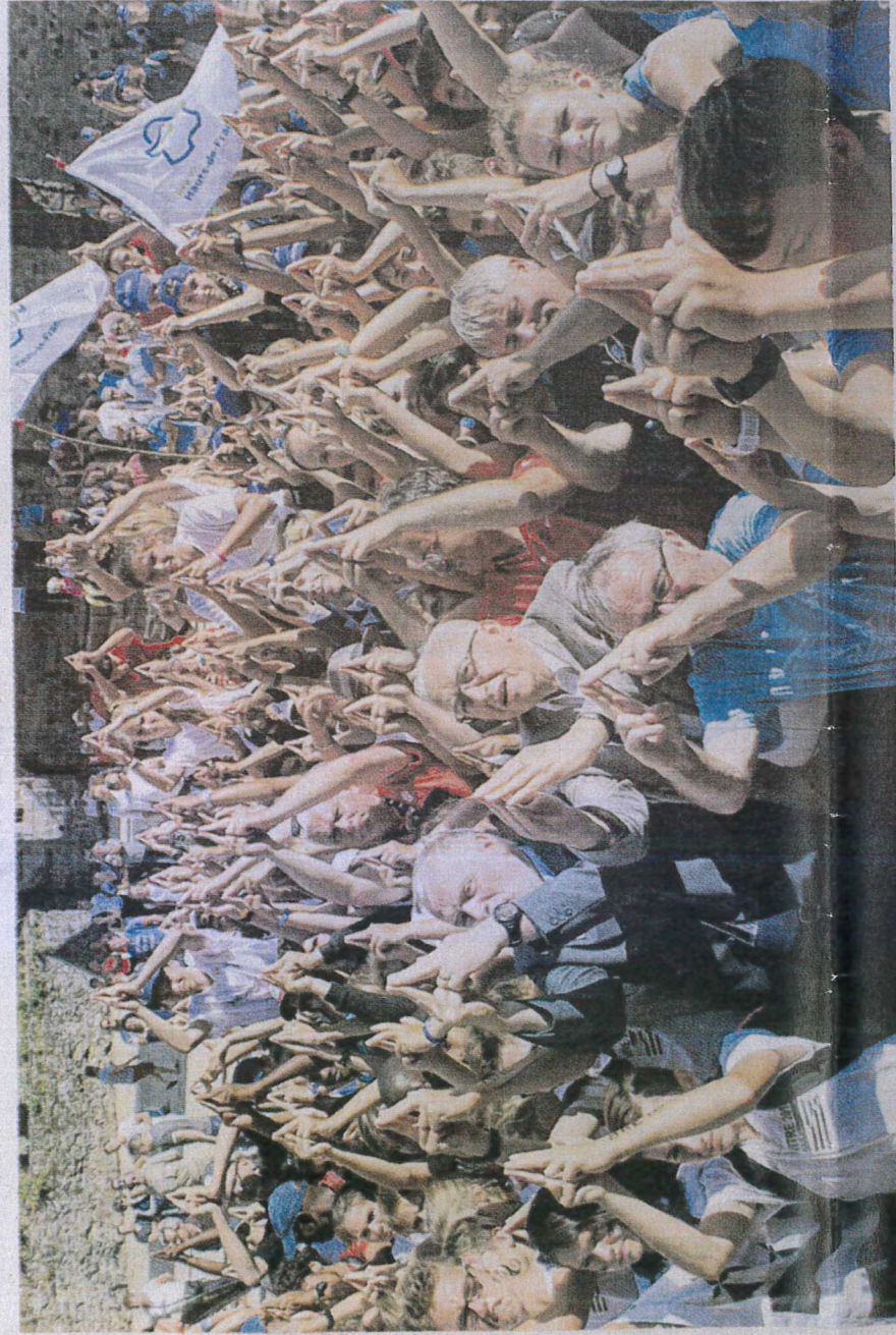
Les jeunes (catégories espoir) ont été reçus à l'Hôtel de ville. A la demande de leurs dirigeants, ils ont fait le vœu de participer aux jeux olympiques 2024 à Paris en faisant un signe de ralliement avec leurs mains, à savoir la Tour Eiffel. Même Pierre Méhaignerie a joué le jeu !

La base de loisirs de Haute-Vilaine, à Saint-M'Hervé, a accueilli les championnats de France en ligne de canoë-kayak, du 12 au 16 juillet. Une belle fête sportive qui a récompensé de nombreux athlètes, avec 125 titres de champions décernés.