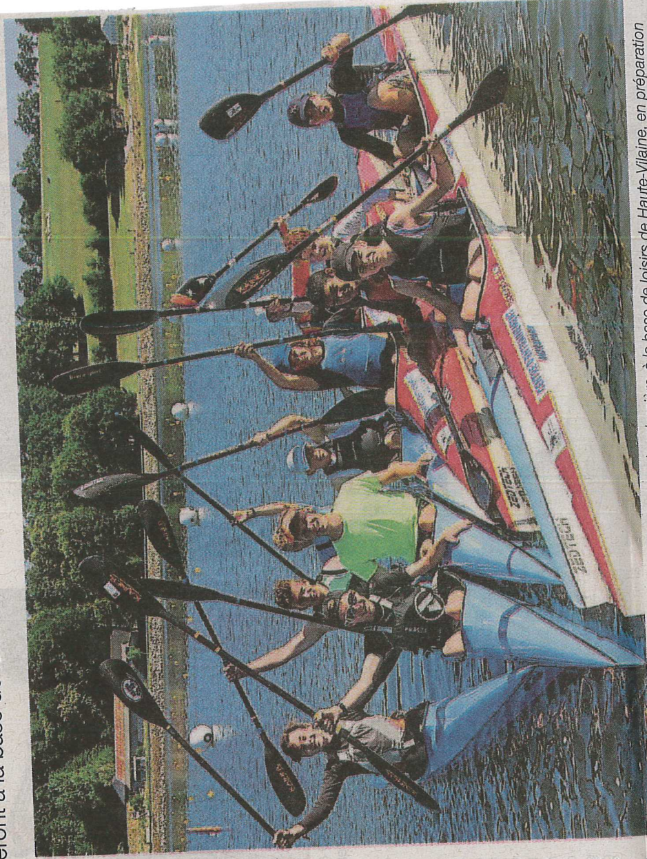
Une partie des jeunes Bretons à l'entraînement la semaine dernière, à la base de loisirs de Haute-Vilaine, en préparation des régates « National de l'espoir ».

C'est la première fois que la base de loisirs de Haute-Vilaine, à Saint-Hervé, accueille les championnats de France de vitesse de canoë-kayak. Le site avait déjà vu se dérouler les championnats nationaux de fond, en 1994 et 2009. La dernière fois qu'un athlète breton avait reçu les championnats de France de vitesse, c'était en 1998. Il s'agissait de Guériédan, en Centre-Bretagne.