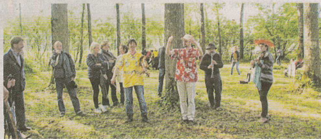
Environ 1 500 personnes de tous âges sont venues aux 22 es Tartines d'artistes

Une fois de plus, la tartine pain-beurre-chocolat a eu du succès, avec sa célèbre bolée de cidre. Après cet incontournable arrêt, les participants ont pu prendre le temps d'admirer certaines expositions de voitures anciennes et de jouets anciens. « Nous vous fixons rendez-vous pour la 23 e édition qui se tiendra le dimanche 6 mai 2018. Dès à présent, vous