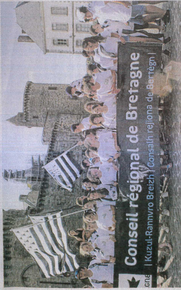
Les jeunes athlètes à leur arrivée au château de Vitré, jeudi 13 juillet