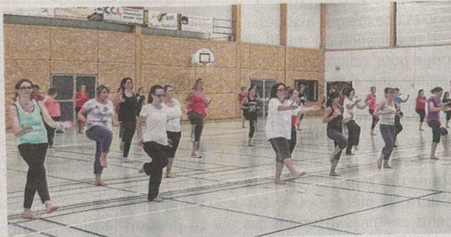
Plusieurs créneaux pour se dépenser à Saint-M'Hervé

Concernant les horaires, les cours adultes de step (à partir de 17 ans) ont lieu le lundi de 19 h 30 à 20 h 30 ; les cours de zumba le lundi de 20 h 30 à 21 h 30 et le samedi de 10 h 30 à 11 h 30 ; le cours de piloxing