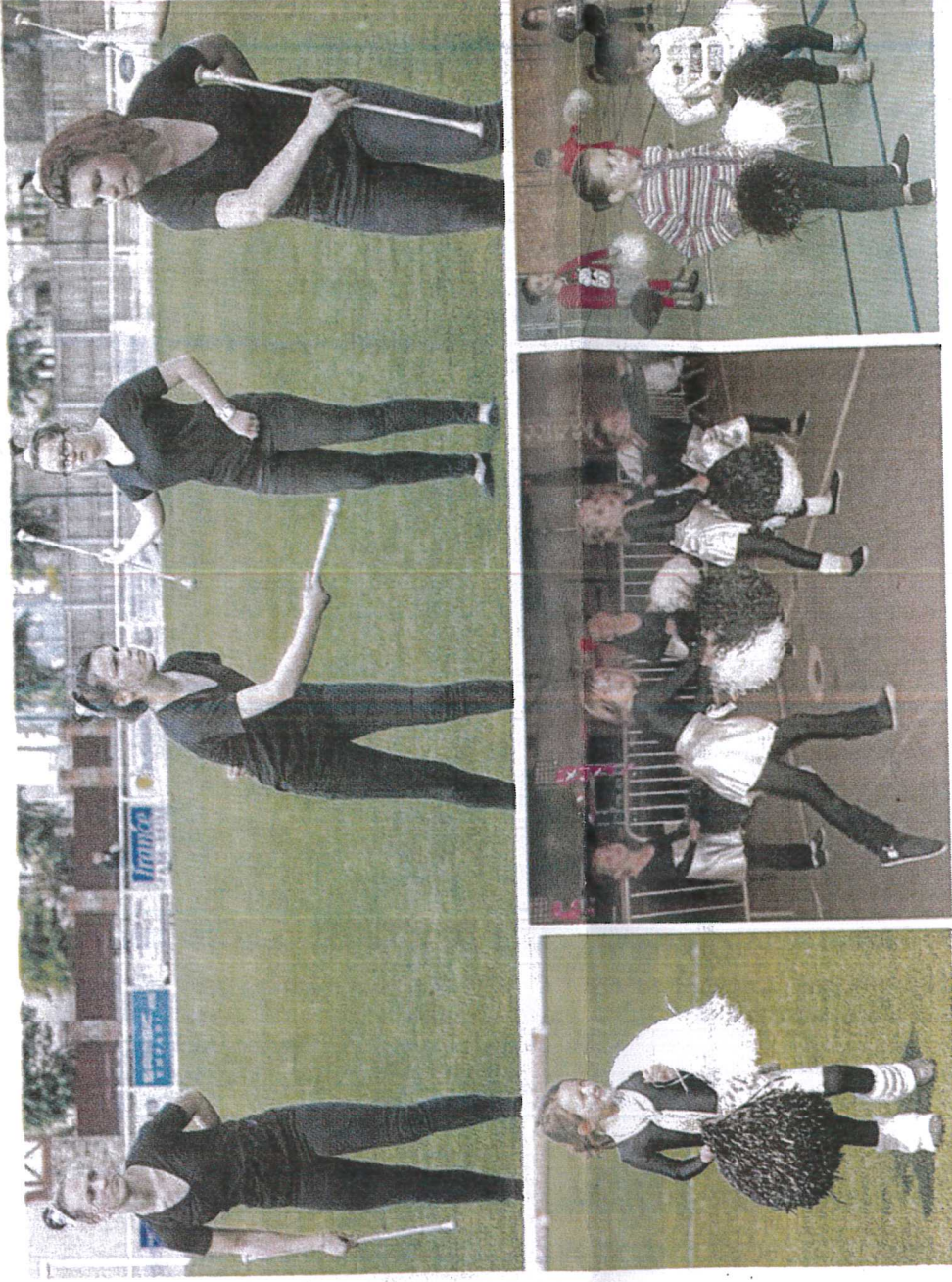
Chaque groupe crée cinq à six chorégraphies en musique par an

Cet été, découvrez cinq associations du canton de Vitré. Cette semaine, les Dem'zells de Saint-M'Hervé, qui regroupe 90 majorettes.