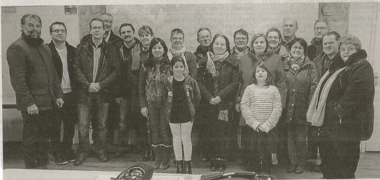
L'amitié entre la commune et Princeville reprend des couleurs.

Une vingtaine de personnes se sont réunies, samedi, à la salle communale Saint-Eloi pour revitaliser les échanges avec la commune de Princeville, au Québec.