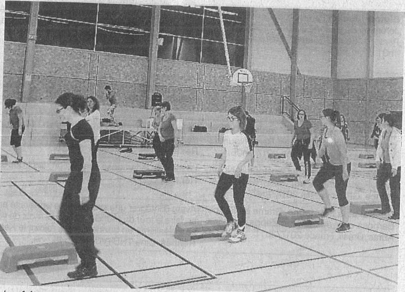
Une fréquentation qui ne se dément pas à la gym.

Contact : Jacqueline Beaudouin, tél. 02 99 76 72 67 ; Rolande Amiot, tél. 06 77 31 77 47 ; gymssaintmherve@gmail.com