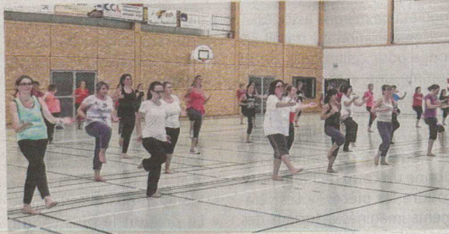
Plusieurs créneaux pour se dépenser à Saint-M'Hervé

Concernant les horaires, les cours adultes de step (à partir de 17 ans) ont lieu le lundi de 19 h 30 à 20 h 30 ; les cours de zumba le lundi de 20 h 30 à 21 h 30 et le samedi de 10 h 30 à 11 h 30 ; le cours de piloxing