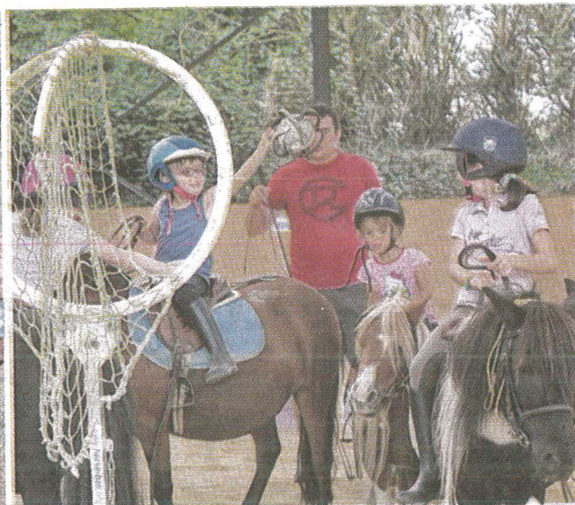
Le domaine de la Haute-Hairie a à cœur de trouver un équilibre entre loisirs et compétition