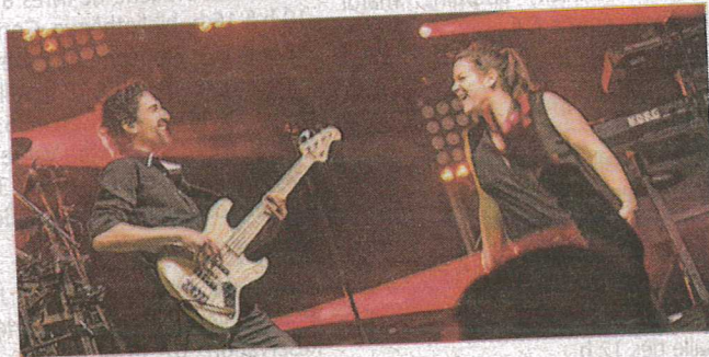
La belle famille

80 ans. Les spectateurs pourront danser durant 4 heures de show annoncées.