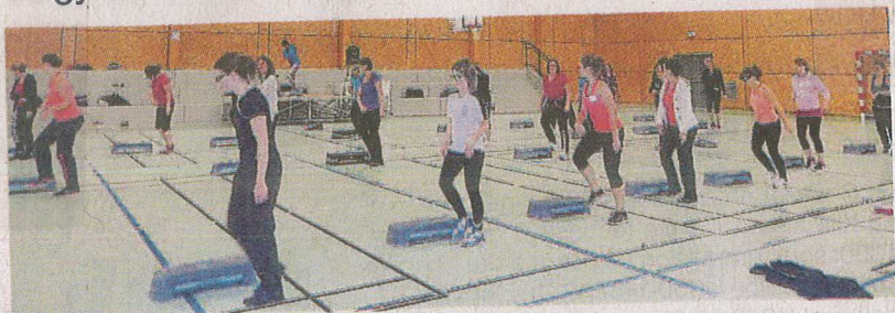
La gym d'entretien reprend du service à Saint-M'Hervé.

Après la période estivale, la gym d'entretien de la commune reprendra mercredi 6 septembre.