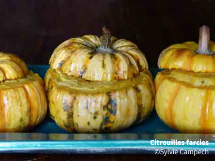
Citrouilles farcies