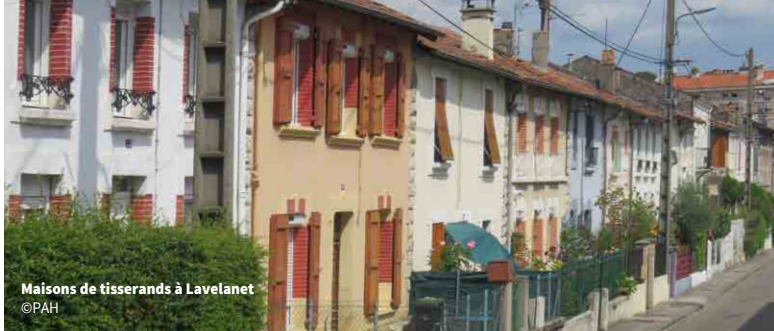
Maisons de tisserands à Lavelanet