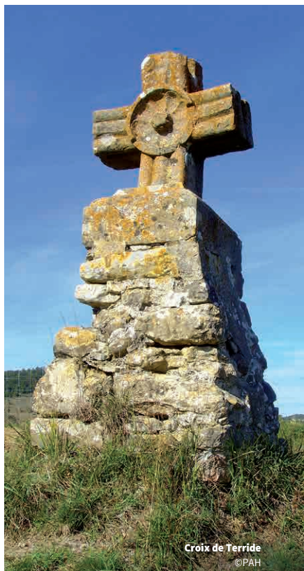
Croix de Terride