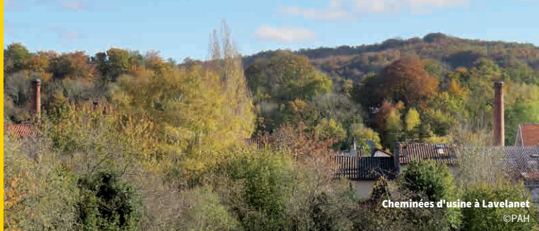
Cheminiées d'usine à Lavelanet