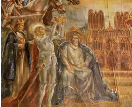
Détail des peintures de Reynold Arnould