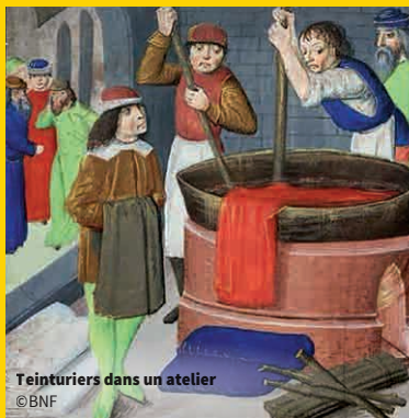
Teinturiers dans un atelier