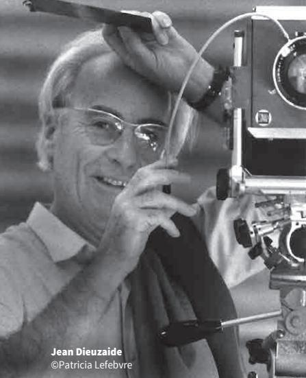
Jean Dieuzaide