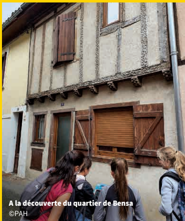
A la découverte du quartier de Bensa

RDV : Devant le Musée du textile, Lavelanet Uniquement sur inscription : www.les-enfants-du-patrimoine.fr