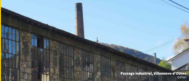
Paysage industriel, Villeneuve-d'Olmès