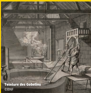
Teinture des Gobelins