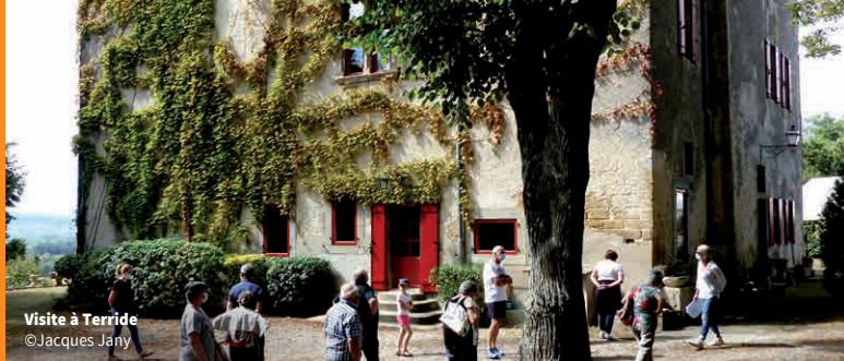
Visite à Terride