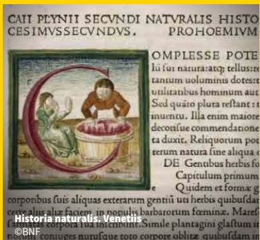
Historia naturalis. Venetis

Voir page 9 pour le détail de la programmation