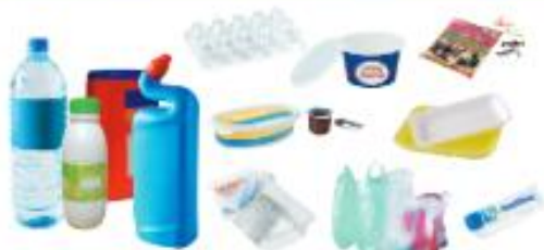
Emballages en plastique

Déposer en vrac dans la poubelle (pas en sac), inutile de les laver. Vous pouvez les aplatir sans les imbriquer.