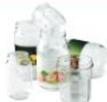
Pots et bocaux en verre