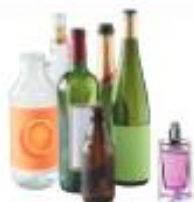
Bouteilles et flacons en verre

Les emballages en verre sont à jeter sans bouchon ni couvercle.