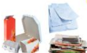
Papiers et cartons