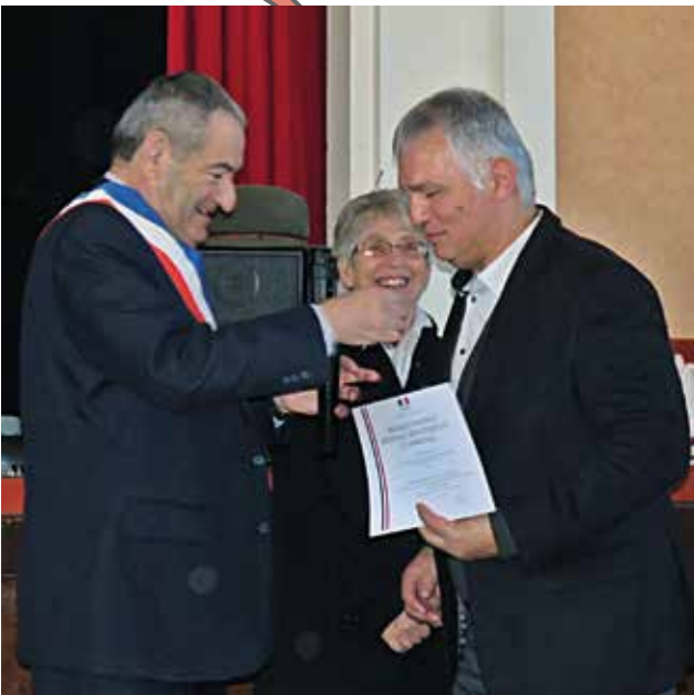
Remise des médailles du travail cérémonie des vœux du 16 janvier 2016