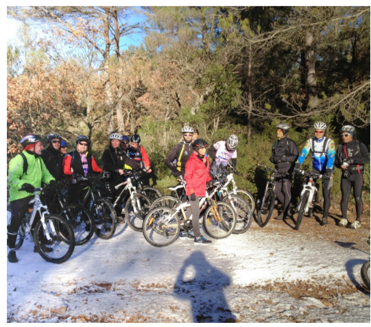
Les VTTistes de Bras au cours d'une magnifique randonnée dans la neige pour le Téléthon 2012