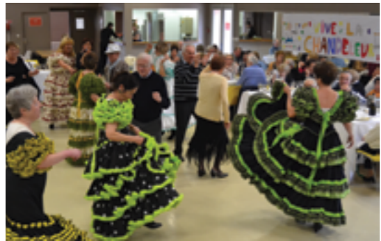
Chandeleur - 7 février