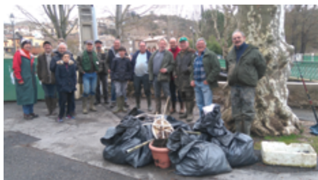
Nettoyage du Cauron - 5 mars