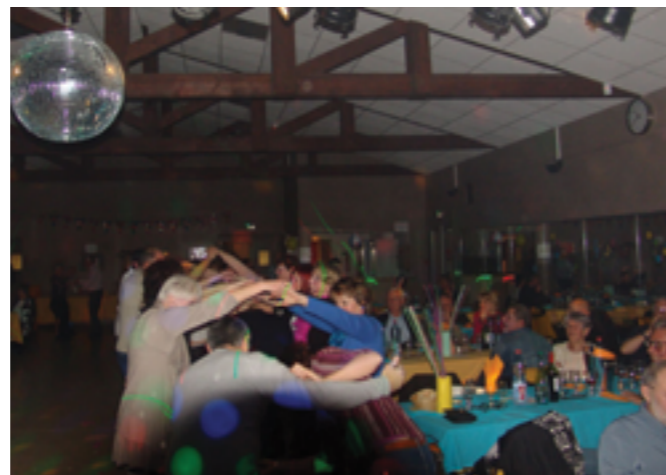
Soirée années 80 - 19 mars