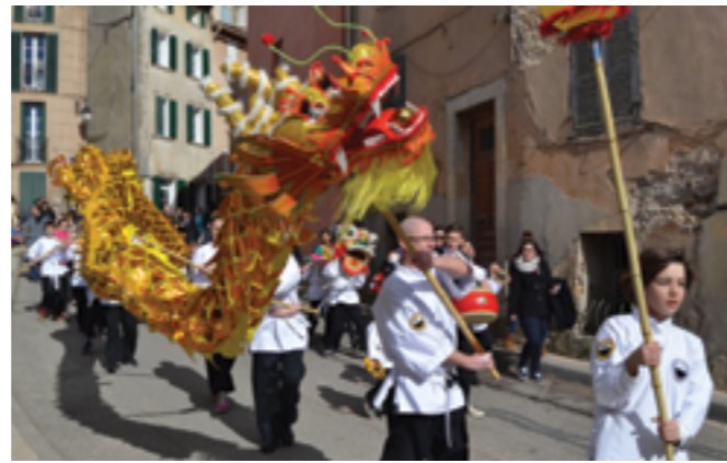
Nouvel an chinois - 5 mars