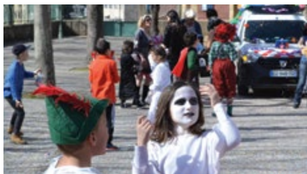
Carnaval - 11 mars