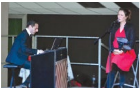
Concert Velvet Rose - 15 janvier