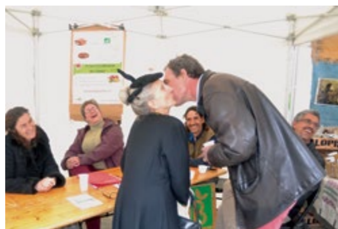
Rencontre du mieux-vivre - 1 er avril