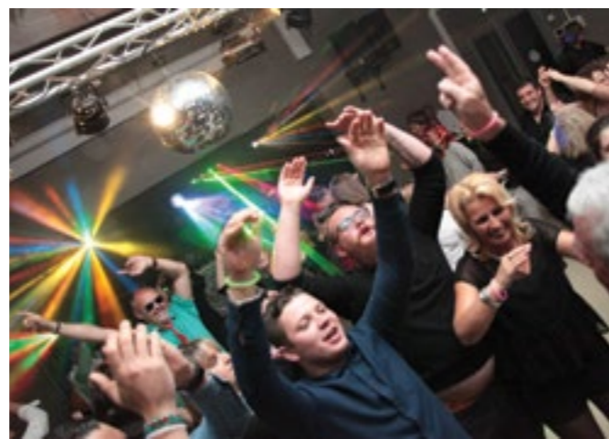
Soirée Disco - 25 mars