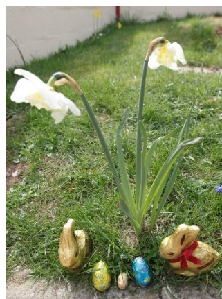
1er - Matthieu Bourgois