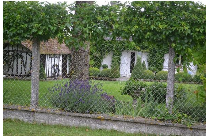
3 ème Alain VANDEMOORTELE