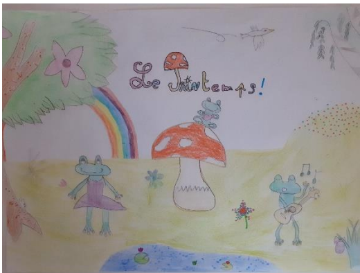
1er - Solange Dugrosprez