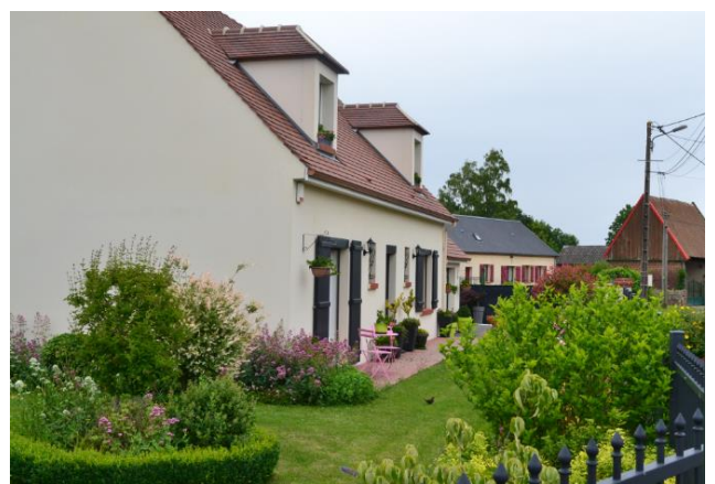
1 er Nicolas PODLUNSEK