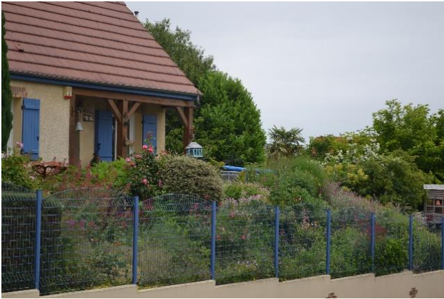
2 ème Stéphane MACRELLE