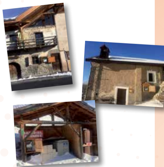
SCHÉMA DIRECTEUR D'EAU POTABLE ET SCHÉMA COMMUNAL DE LA DÉFENSE EXTÉRIEURE CONTRE L'INCENDIE

Nous organiserons des formations avec des personnes qualifiées pour savoir s'en servir. Nous vous informerons des jours de ces formations afin que vous puissiez y participer.