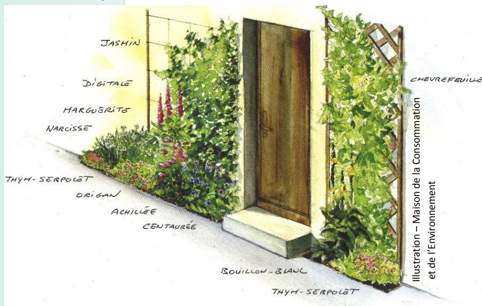
Illustration – Maison de la Consommation et de l'Environnement