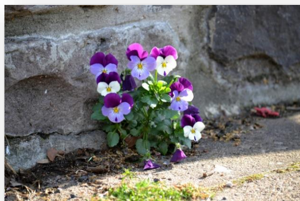
Illustration - MTSOfan / flickr.com