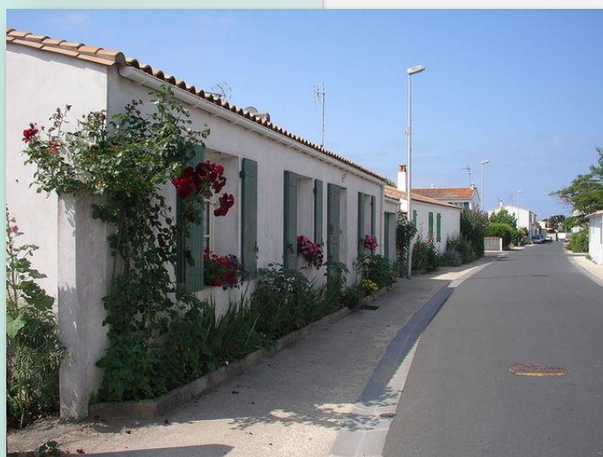
Illustration – Rue fleurie – Ile de Ré