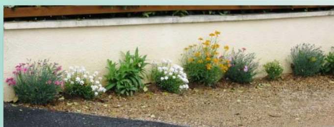
Illustration - Ménétréol

La végétalisation des pieds de murs varie selon la quantité et la qualité de l'espace disponible. Elle se réalise sous forme de plate-bande ou de massifs plus ou moins généreux, en associant vivaces, bisannuelles, bulbes, grimpantes, parfois arbustes, sans oublier de laisser la flore spontanée se développer.