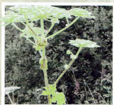
LA BERCE DU CAUCASE