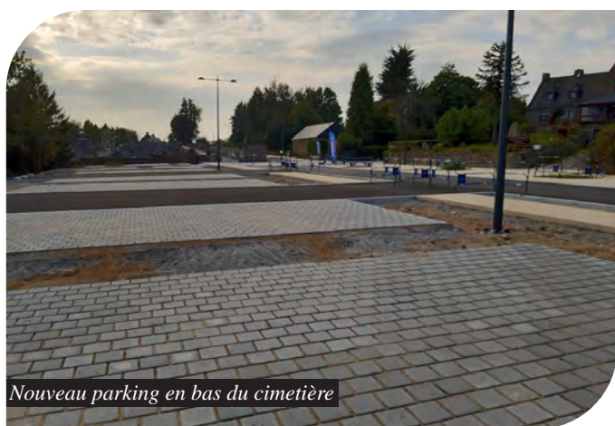
Nouveau parking en bas du cimetière

La 1 ère phase des travaux est finie depuis fin juillet. La 2 de phase est actuellement en cours avec l'aménagement de la voirie et de la continuité de la voie verte (piétonne et vélo)