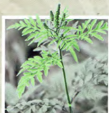
L'AMBROISIE À FEUILLES D'ARMOISE

COMMENT LES RECONNAÎTRE ? QUE FAUT-IL FAIRE ?