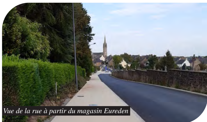
Vue de la rue à partir du magasin Eureden