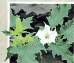
LE DATURA STRAMOINE