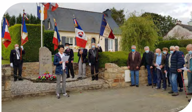
Dépôt de la gerbe devant la stèle en présence des porte-drapeaux.

La population a répondu présente pour rendre hommage aux 68 hommes des Forces Françaises de l'Intérieur (FFI), résistants et civils, qui ont arrêté la colonne infernale composée de 247 soldats Allemands. Partis d'Erquy, ces soldats ont abattu et blessé de nombreux hommes et femmes dans les communes qu'ils ont traversées.