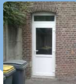
Porte de derrière

Les travaux du programme de rénovation du patrimoine communal se terminent. Ce projet, comprenant la rénovation des toitures de la sacristie de l'église de Solesmes et de la salle Casanova ainsi que le changement des menuiseries, est financé en partie par le Département du Nord à hauteur de 50% , soit 34 888 €, par le biais d'une subvention "Aide Départementale aux Villages et Bourgs volet "relance" 2020.