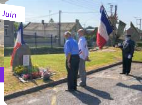
la stèle au parking de la piscine