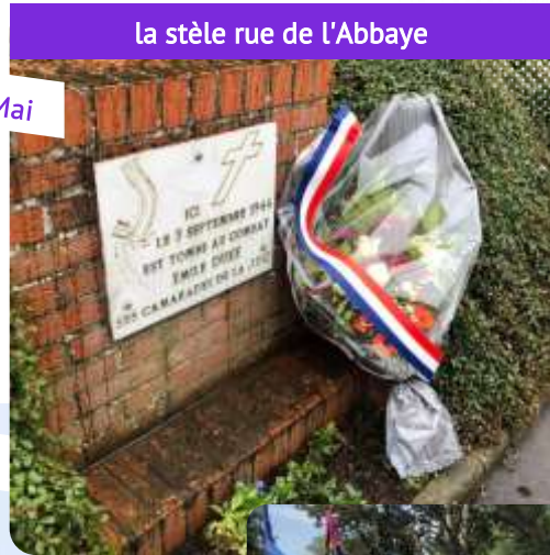
la stèle rue de l'Abbaye