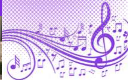
Le Piano du Lac (Jazz/Classique) à la Piscine Intercommunale le Mardi 31 Août