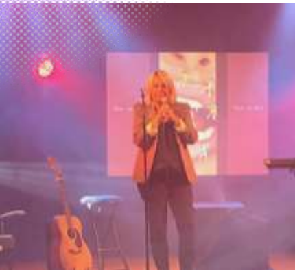
@2line à la Salle Carlier le 22 Juillet pour le centre de loisirs