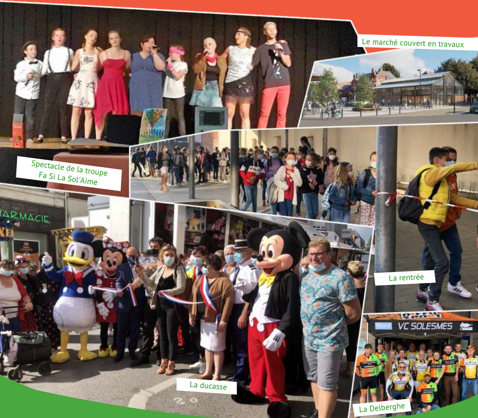
Le marché couvert en travaux