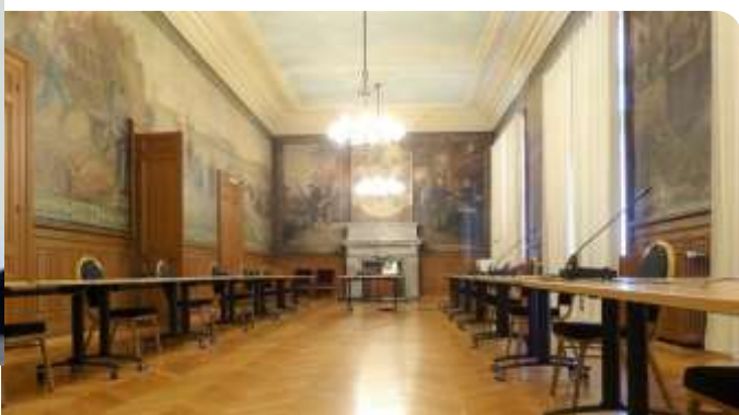
Salle des cérémonies de l'Hôtel de Ville de Solesmes