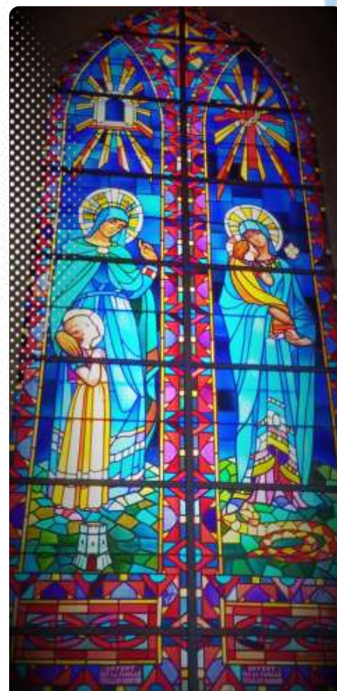
Vitrail de l'Eglise d'Ovillers

N'hésitez pas à nous adresser votre soutien à l'adresse eglise-ovillers@outlook.fr