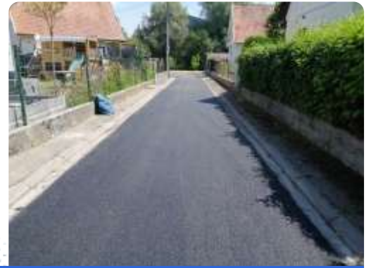
Les impasses rue Jules Guesde