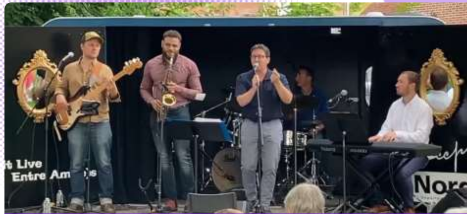
The Angel City Player Quartet (concert de Jazz) au Jardin Public le 11 Juillet