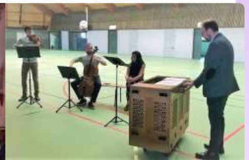
Harmonia Sacra à la salle Chéri Delsarte et à l'Eglise d'Ovillers le 10 Août