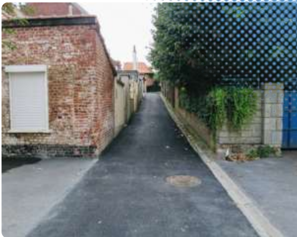
Les quatre impasses rue de l'Abbaye : réfection des chaussées en enrobé après les travaux du renouvellement du réseau d'eau potable