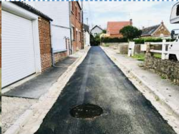
La rue Guy Moquet