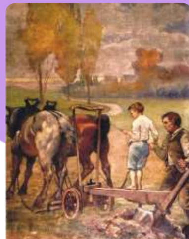
Hôtel de ville de Solesmes Le premier sillon

Un livre retraçant la vie et la carrière d'Henry-Eugène Delacroix, de Claudine Pardon, sera prochainement en vente à la librairie Daubour au prix de 35 euros. Les bénéfices provenant de la vente seront bloqués sur un compte spécial afin de contribuer à la restauration des peintures Solesmoises.