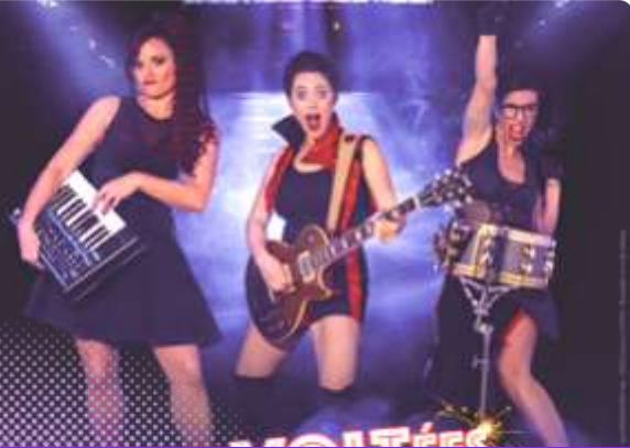
Les Swingirls le 27 Juin à la salle Delberghe