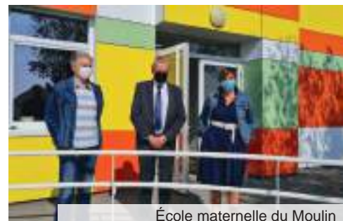
École maternelle du Moulin