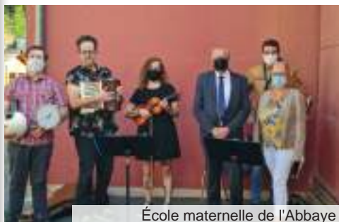
École maternelle de l'Abbaye