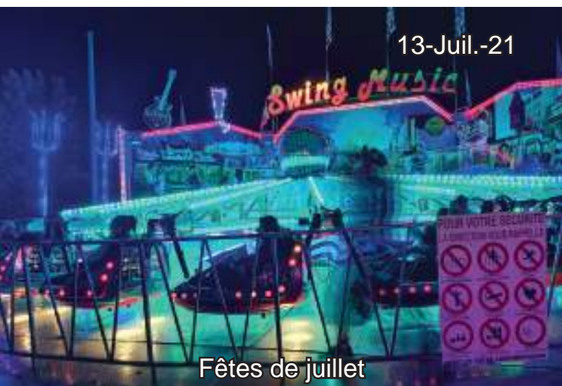
Fêtes de juillet