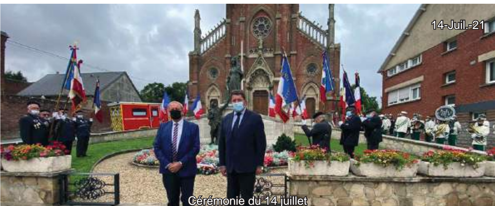
Cérémonie du 14 juillet