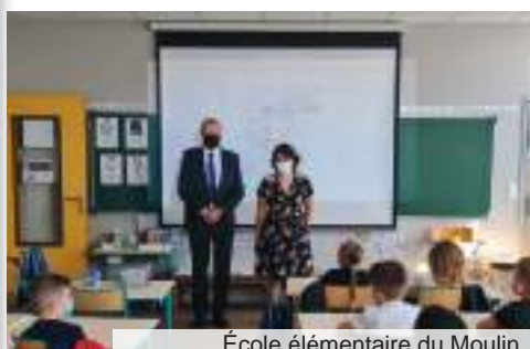
École élémentaire du Moulin