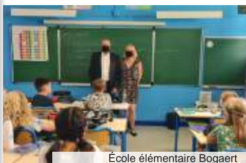
École élémentaire Bogaert