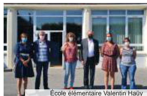
École élémentaire Valentin Haüy