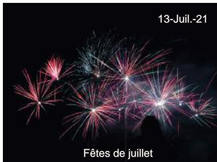
Fêtes de juillet