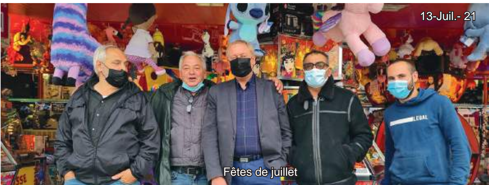
Fêtes de juillet