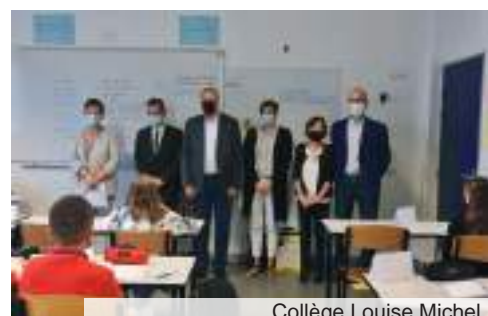
Collège Louise Michel