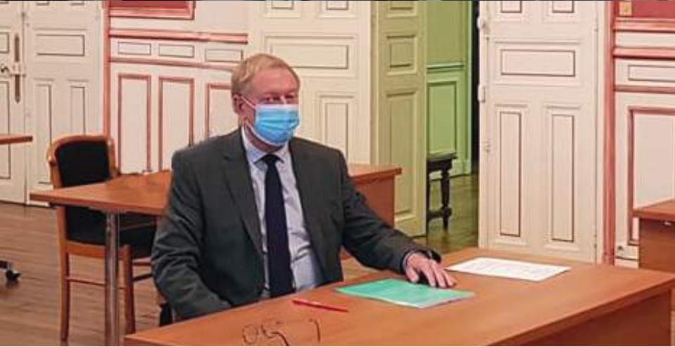
Conseil Municipal en visio-conférence