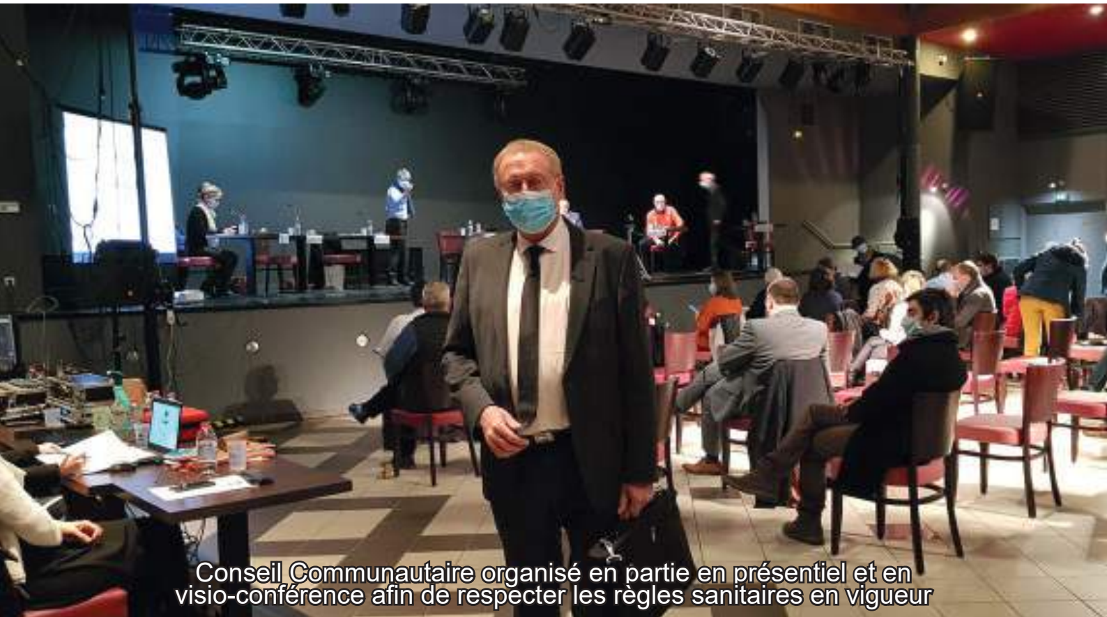
Conseil Communautaire organisé en partie en présentiel et en visio-conférence afin de respecter les règles sanitaires en vigueur