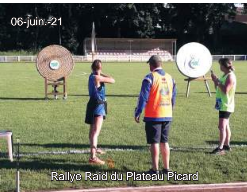
Rallye Raid du Plateau Picard