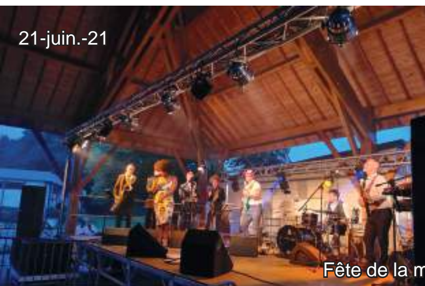
Fête de la musique 2021