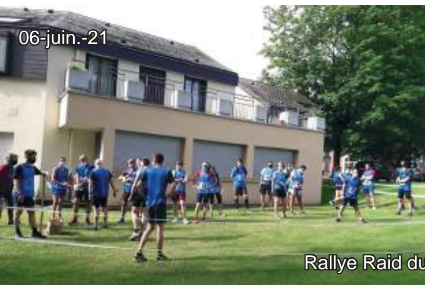
Rallye Raid du Plateau Picard