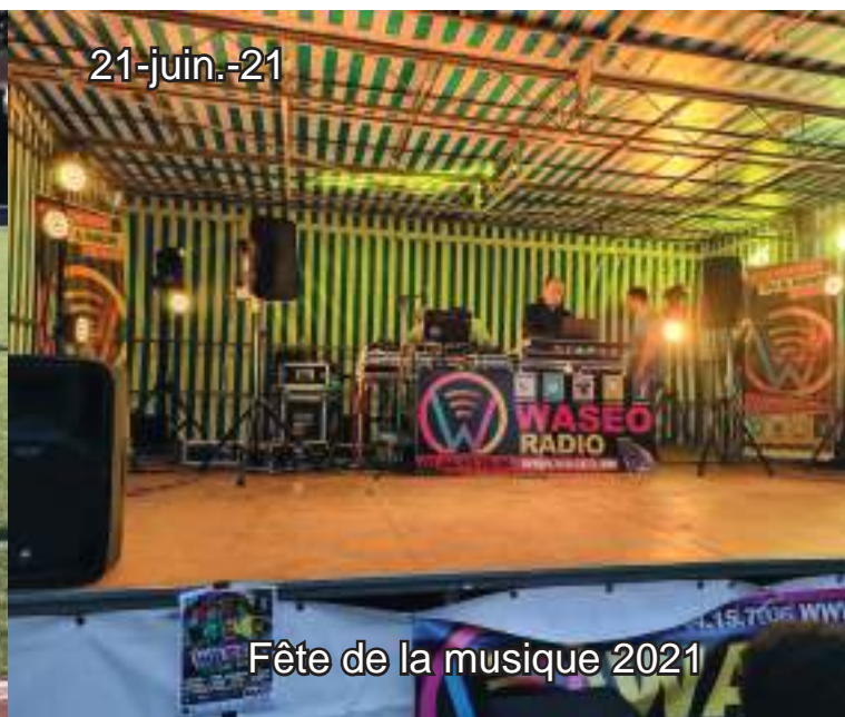
Fête de la musique 2021