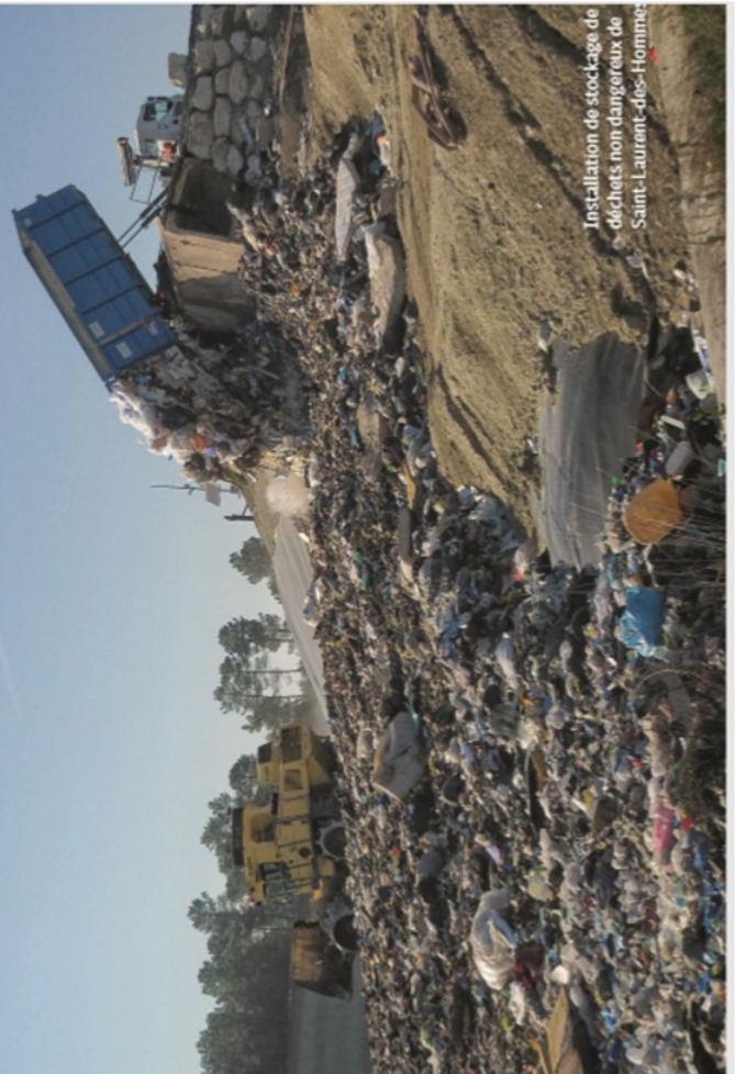
Installation de stockage de déchets non dangereux de Saint-Laurent-des-Hommes