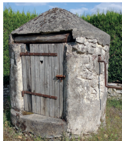
Puits des Châletières

Leur profondeur varie. Le puits sera peu profond s'il est proche de la nappe phréatique, beaucoup plus s'il doit atteindre une source. Le sourcier a fait croire à sa magie avec sa branche de coudrier pendant longtemps. Le puisatier, quant à lui, devait ensuite creuser à la profondeur décrétée. Ces puits ne sont que la margelle surmontée d'une armature tenant la poulie pour monter des seaux, ils sont emmurés avec une porte d'accès et souvent une petite ouverture du côté opposé. Ils ont gardé la manivelle à l'extérieur. Ces puits communaux ne pouvaient pas être exposés puisque non surveillés. Un enfant pouvait y tomber. Un animal pouvait glisser et ainsi polluer l'eau (un chat, une souris, parfois les deux ?). Les problèmes saisonniers étaient bien sûr la glace en hiver et le tarissement en été. Le problème créé par les hommes était la méchanceté d'empoisonner un puits pour nuire à un individu ou un village entier.