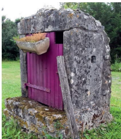
Puits de la Lande