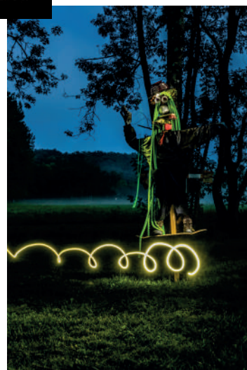
Fabrice Campagné, Président

Depuis le 1 er septembre, nous avons repris nos réunions et avons déjà réservé la salle des fêtes le 14 et 15 mai 2022 pour notre exposition photos macro et proxi, suite à l'annulation de 2021.