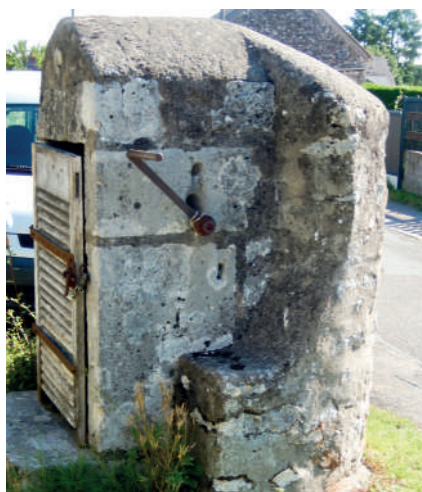
Puits des Ansaults