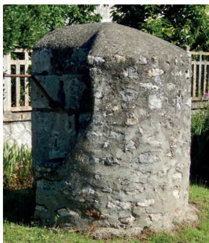
Puits des Ansaults

A Artannes, outre tous les puits inclus dans une propriété (difficile de les inventorier : certains ont été comblés il y a longtemps, d'autres creusés aussi récemment qu'il y a 50 ans), il y avait une douzaine de puits communaux. On peut encore en voir cinq : deux aux Ansaults, un aux Mattés, un à la Lande et un aux Châletières. Vous pouvez les admirer sur le parcours de la randonnée patrimoine. Les autres ont été rasés et recouverts. Il y en avait trois dans le bourg. Vous marchez sur l'un d'eux dans la Salle des Fêtes, un autre se situait devant la Casadéenne et un troisième à l'arrêt de bus du côté de l'église.