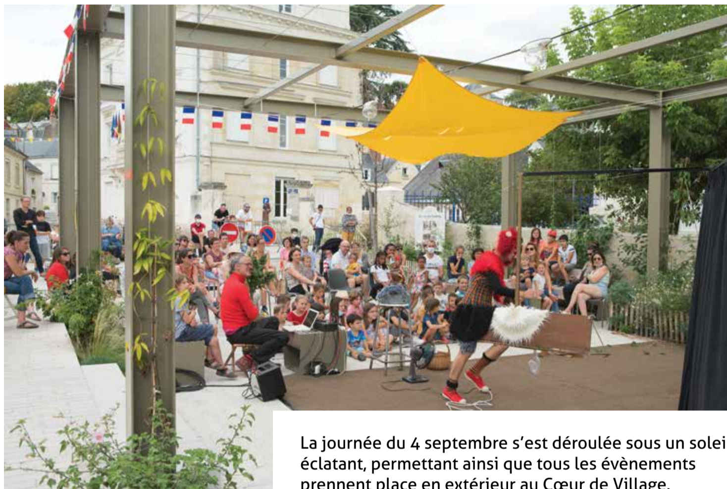
La journée du 4 septembre s'est déroulée sous un soleil éclatant, permettant ainsi que tous les événements prennent place en extérieur au Cœur de Village.

L a journée a débuté avec le Forum des associations qui s'est tenu sous la halle et avenue Maginot de 10h à 15h30. Tôt le matin, les bénévoles sont venus préparer leur stand. Cette année, le handball club vouvrillon proposait une buvette et une restauration sur place en toute convivialité. Un grand merci à eux ainsi qu'à tous les bénévoles des associations pour leur présence. Puis, vers 11h30, les nouveaux Vouvrillons ont été accueillis dans la salle des Fêtes. À cette occasion, les élus leur ont présenté la commune, ses équipements, ses services ainsi que les animations culturelles. À l'issue, un sac a été remis à chaque famille présente avec contenant diverses informations sur la commune (plan, Vivons Vouvrays , parcours de Raconte-moi Vouvrays... ) et un magazine sur le vin ligérien.