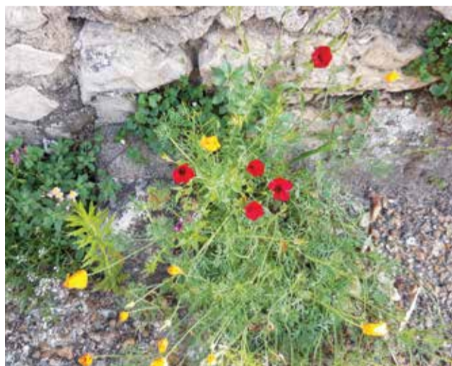
Mélange de graines de l'opération « Fleurir ma rue » : alysson maritime, pavot de Californie, lin à grandes fleurs, linaire du Maroc.