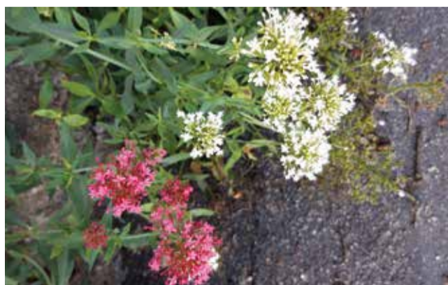
Les centranthes rouge et blanc (également appelés « fausse valériane »).