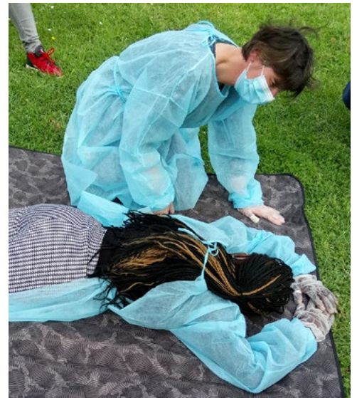
Formation aux premiers secours pour les assistantes maternelles juin 2021