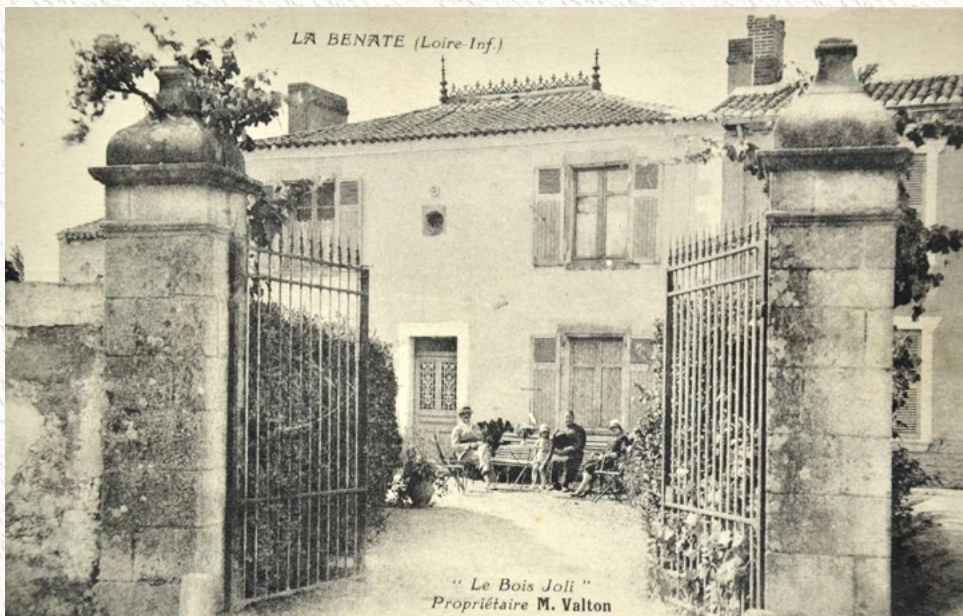
La maison Valton à la Benate

Réserver auprès de La Ligne 06 63 53 42 49