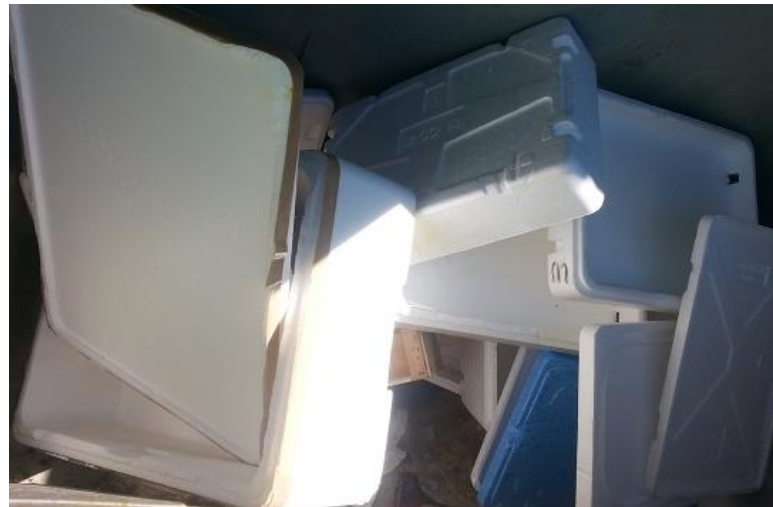
CE REGIE DECHETS