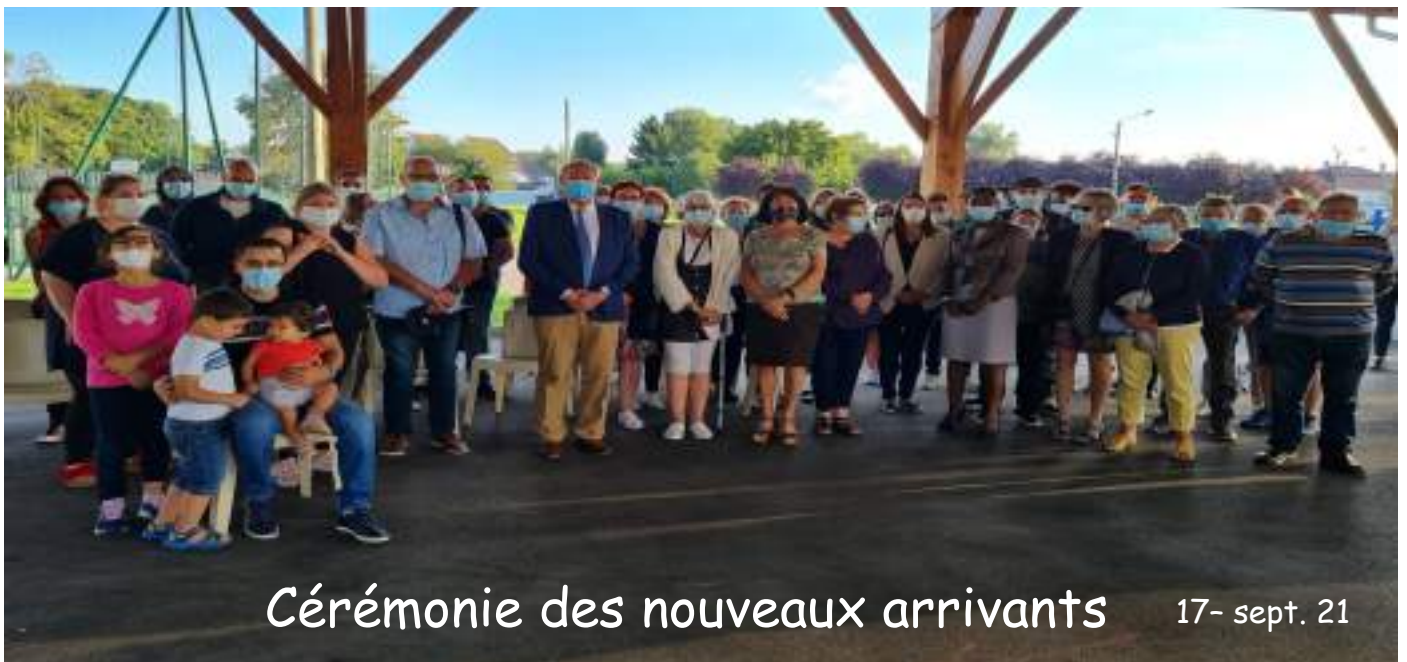
Cérémonie des nouveaux arrivants