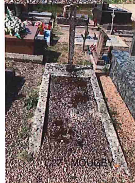
C27 - MOUGEY