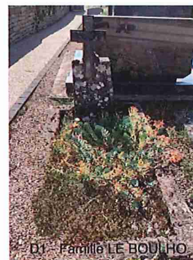
D1 - Famille LE BOULHO