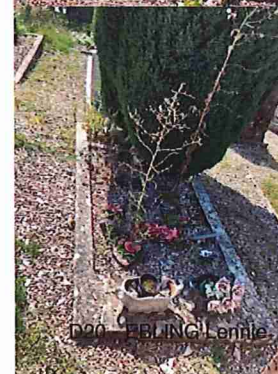
D20 - EBLING Lennie