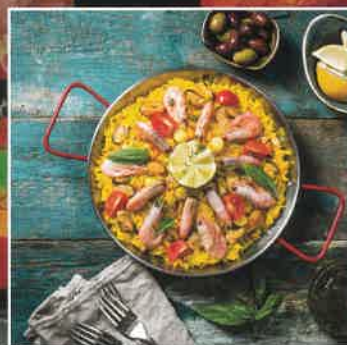
23 | Soirée caritative des Illuminées