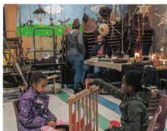
6 octobre SAVEURS D'AUTOMNE « plaisir des jeux d'autrefois »