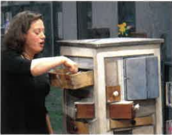
26 janvier COMPAGNIE CARACOL « un mal des mots : une pharmacopée poétique »