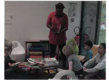
QUI SONT CES NOUVEAUX VENUS À LA MÉDIATHÈQUE ?... « les jeunes explorateurs de la crèche CRAPAHUTTE de Moulins s'Yèvre »