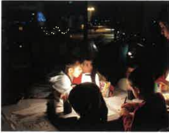
18 janvier NUIT DE LA LECTURE « pyjama obligatoire pour petits et grands »

Tout au long de l'année 2019, la Médiathèque a proposé des animations en partenariat avec la Médiathèque Départementale du Cher, la Communauté de Communes des Terres du Haut Berry, le Café Littéraire et l'équipe enseignante.