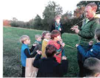
11 octobre NATURE 18 « de la récolte à la fabrication »