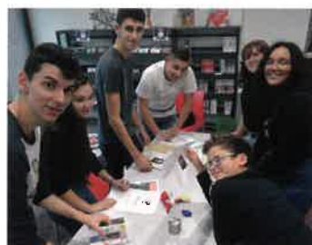
31 octobre ESCAPE GAME « la magie des énigmes s'invite rue de la Folie »