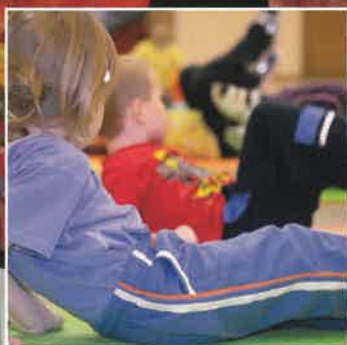
14 | La vie à l'école