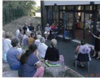
13 septembre APÉRO-LECTURE « un auditoire attentif »