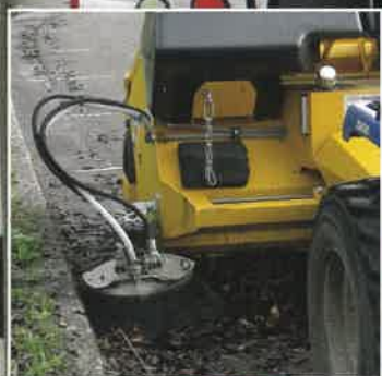
13 | Balayeuse